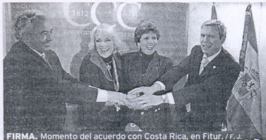
FIRMA. Momento del acuerdo con Costa Rica, en Fitur.

Montevideo. El objetivo es iniciar proyectos concretos de colaboración entre las ciudades turísticas medianas a ambos lados del Atlántico. Este acuerdo se firmó ya en la última edición de Fitur y la intención de ambas partes es que en el próximo encuentro del sector celebrado en Madrid se presenten acciones formativas ya elaboradas, como el intercambio de estudiantes especializados en hostelería o turismo. / M. M.