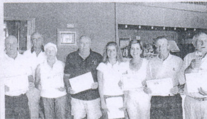
Costa Ballena. Allí disfrutaron los seniors con esta prueba Uva de Oro, que organizó la asociación.