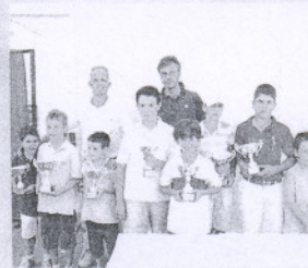
Alborán. El torneo infantil congregó a muchos participantes.