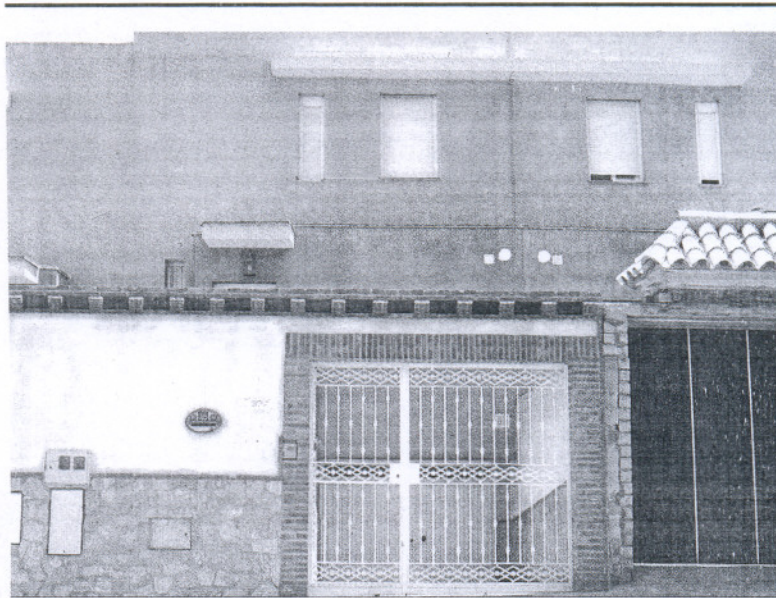
Desde una de estas ventanas se precipitó al vacío la víctima.

En un comunicado, Cuenca señaló que uno de los estudios realizados en 2004 se centró en la mortalidad en los municipios del Campo de Gibraltar entre 1975 y 2000, para calcular las tasas ajustadas por edad, para todas las causas y causas específicas, por sexo y su tendencia por municipios. La parlamentaria socialista señaló que, según pudo saber, el informe concluyó que la mortalidad en el Campo de Gibraltar "tiene un patrón similar al resto de Andalucía y del Estado, situando las enfermedades cardiovasculares y los procesos oncológicos como las primeras causas de mortalidad". Asimismo, indicó que "los resultados sugieren también que no existe un patrón de mortalidad relacionado con una posible hipótesis de origen medioambiental".