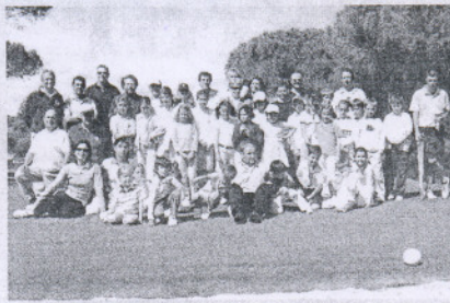
Bellavista. Las pruebas infantiles suelen tener una abundante participación en este campo onubense.