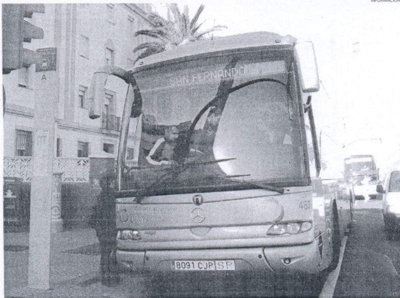
La empresa habla del descenso del número de viajeros como causa de la crisis, pero el comité lo pone en duda.