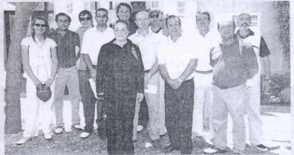
Almenara. Este campo gaditano acogió una prueba benéfica que gozó de abundante inscripción, a pesar de jugarse por parejas.