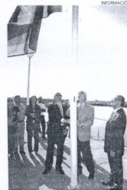
La bandera ondea ya en el puerto.