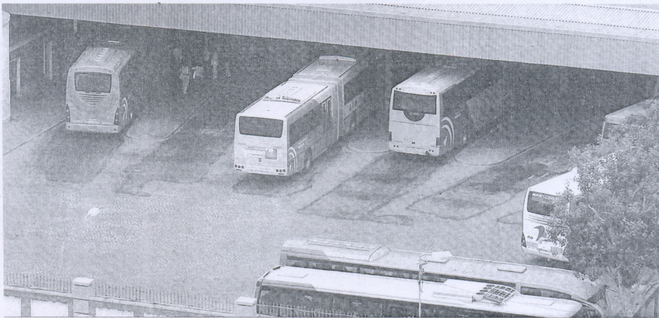
Vista aérea de la estación de autobuses de la compañía Comes de la capital gaditana.