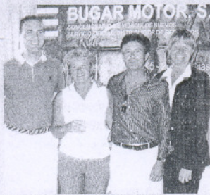
La Cala. La Challenge Peugeot tuvo un enorme éxito en Mijas.