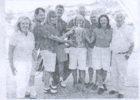
La Cala. El Trofeo Día Interclubs resultó muy animado.