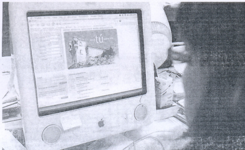
PÁGINA. La web ya cuenta con unas veinte ofertas de alojamientos en la provincia.

Un registro de morosos y estafas facilita la gestión a los hoteleros