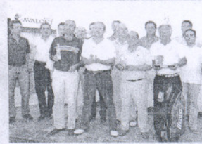
Antequera. Se inauguró la disputa del premio Avalon.