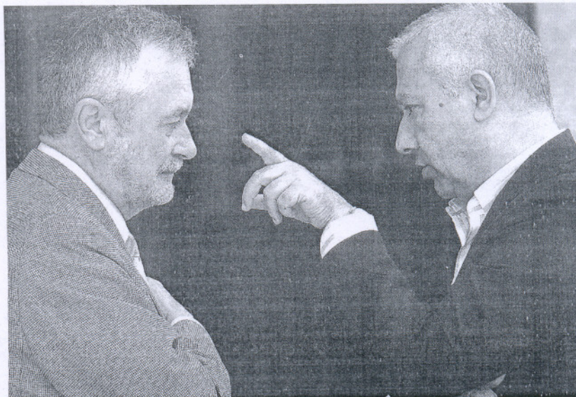
PUNTOS DE VISTA. El consejero de Economía, José Antonio Griñán, y el líder del PP-A, Javier Arenas.

Los grupos podrán sancionar hoy un acuerdo parcial sobre el nuevo modelo