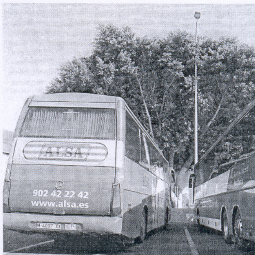
National Express es dueño de autobuses Alsa y Alsina Graells.