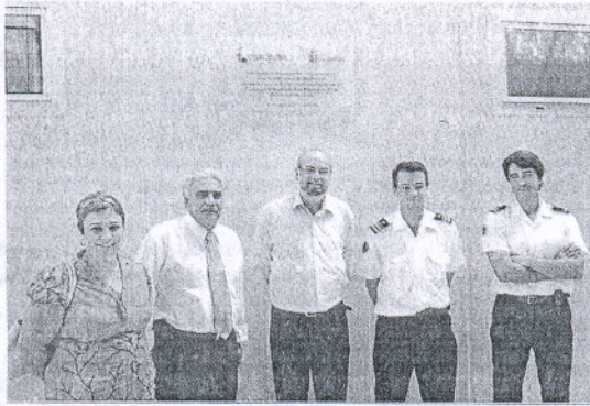
El parque de bomberos de El Colorado fue inaugurado el pasado viernes.

próximas fechas, según el compromiso adquirido con la Diputación provincial, se construirá otro parque de Bomberos más para los municipios de Barbate y Vejer, con lo que estaremos hablando de dos parques de Bomberos para la Janda litoral".