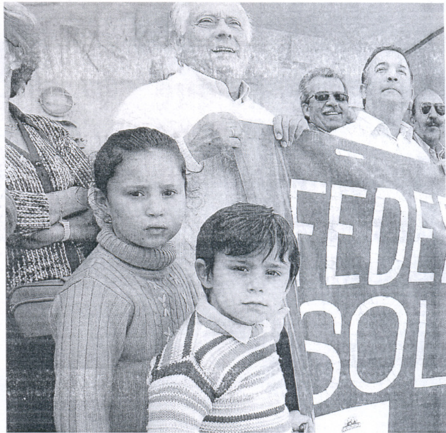
MANIFESTACIÓN. Colectivos de la Zona Norte vienen protagonizando protestas para pedir que se

Los isleños disfrutarán del nuevo centro de Hermanos Lauhé, con capacidad para 20.000 pacientes, en unos pocos meses. Las instalaciones han contado con un presupuesto de 300.000 euros y recuperarán todos los pacientes que se derivaron al resto de ambulatorios de la ciudad para ser atendidos. A finales de 2009 empezarán las