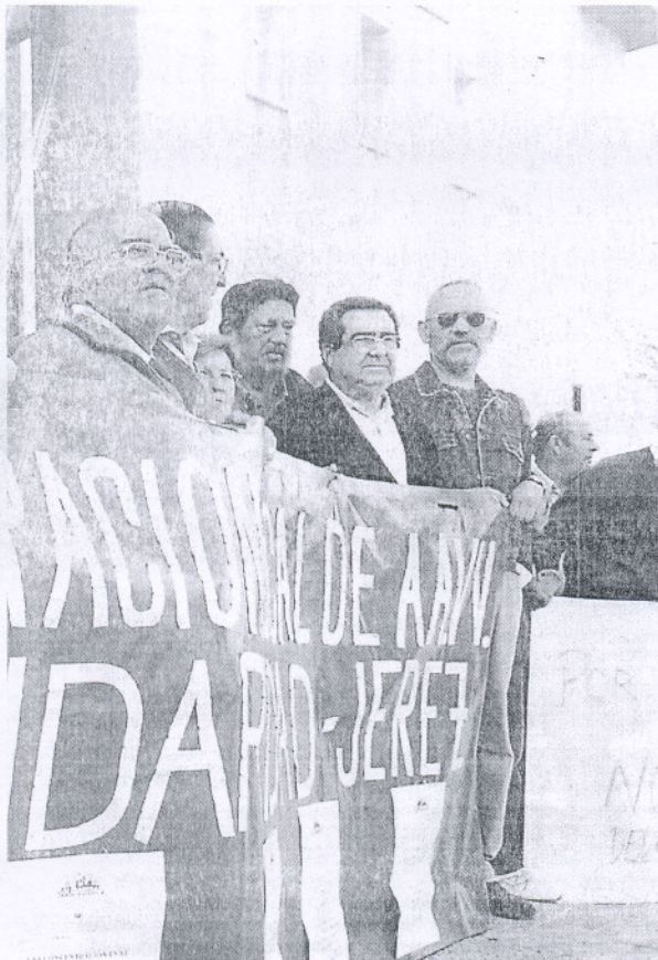
levantando el centro de salud de La Serrana.

Los fisioterapeutas alertan del peligro que suponen para la salud los masajes ilegales