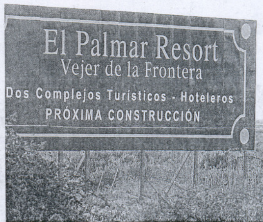
Cartel que anunció durante unos meses las obras de los hoteles de Vejer.

En estos momentos la urbanización del complejo está prácticamente finalizada y las primeras de sus 1.700 casas previstas están a la venta. Los cuatro proyectos hoteleros que ocuparán la primera línea del litoral chipionero, sin embargo, aún no han empezado a construirse y acumulan varios años de retrasos. Sólo la cadena Best Hotels ha mostrado interés en iniciar las obras de su primer hotel que suma 500 de las 1.300 habitaciones de cuatro y cinco estrellas planificadas en Chipiona.