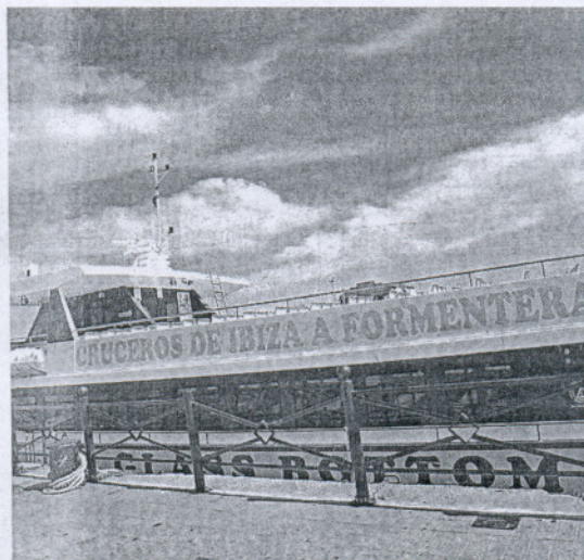
El barco alquilado para reforzar el servicio marítimo está en El Puerto.

La empresa, así las cosas, tiene previsto prorrogar el arrendamiento de esta embarcación durante el tiempo necesario para acometer además unas mejoras que debe llevar a cabo en toda la flota. En concreto, según han informado a este diario desde el ente metropolitano de transportes, hay que proceder a cambiar las tomas de agua a todos los catamaranes. Así que, una vez que esté ya reparado el barco averiado, y se le hayan realizado además las modificaciones necesarias, se incorporará al servicio, procediéndose