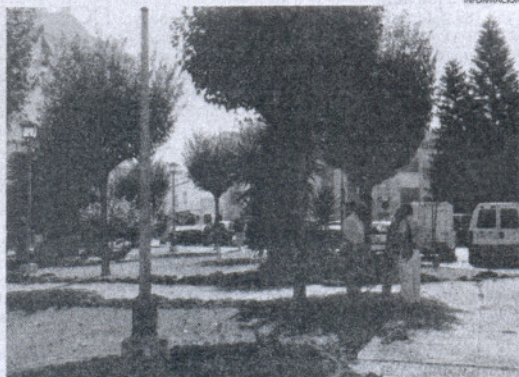
Los jardines mostrarán así mejor aspecto para el uso de los vecinos.

de la solería del acerado perimetral, la zona de hormigón y de los bordillos, para continuar con la colocación de una nueva solería en todo el acerado que rodea las zonas ajardinadas. Además, gracias a este proyecto, subvencionado en parte por la Diputación provincial de Cádiz, también se le dará más altura a los jardines y se mejorará la superficie de paseo entre estas zonas verdes.