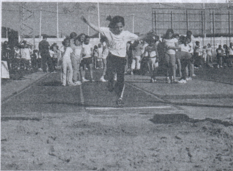
Gracias a la encuesta se dispondrá de una mejor manera de gestionar las instalaciones deportivas locales.

Según aclaró el delegado municipal, a través de este plan se pretende recoger la demanda que presenta el deportista roterño, estudiar y valorar los suelos que el Ayuntamiento tiene a su disposición como parcela para equipamiento deportivo para la creación de nuevas instalaciones deporti-