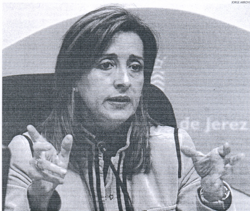
La alcaldesa asegura que Jerez puede hacer esa propuesta porque tiene "los deberes hechos" en materia de VPO.

La alcaldesa aseguró que "comprendía" y "respetaba" la decisión de las instituciones competentes con respecto a la propuesta, "entiendo que se diga que todos los ayuntamientos andaluces tengan hecha también la tarea", lo que ha de entenderse como que tienen que tener suelo suficiente para ejecutar viviendas de VPO. "Pero esa tarea, insistió, el Ayuntamiento de Jerez la tiene hecha",