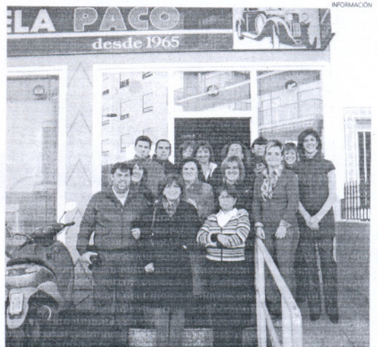
Los alumnos recibieron sus diplomas en la autoescuela que les ha formado.

La siguiente convocatoria tuvo lugar el pasado martes, y de las cuatro personas que acudieron a examinarse de la parte teórica, todas fueron consideradas aptas. A día de hoy, de los 15 participantes del curso de Seguridad Vial de UPA Cádiz tan sólo quedan dos por acudir por primera vez a este examen.