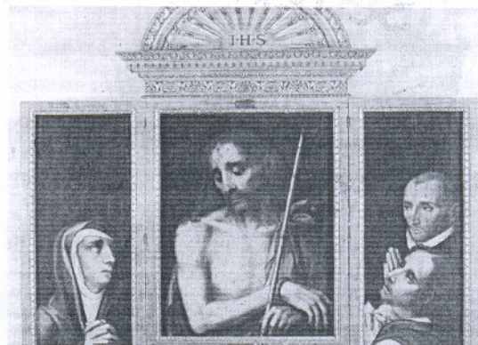
JOYA. Triptico de Luis de Morales, una de las piezas expuestas.

Más adelante, administraciones locales y provinciales, como ayuntamientos o diputaciones, también