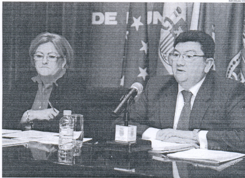
El nuevo proyecto está enfocado a auxiliar a aquellas personas cuya situación se agrava con motivo de la crisis.

Serán cincuenta las familias que se pueden ver beneficiadas dentro de este programa, que durante seis meses podrán tener acceso a un 75 por ciento del sueldo mínimo interprofesional. A cambio, los solicitantes realizarán un periodo formativo y otro laboral, en el que llevarán a cabo tareas de peón en distintos puntos de la localidad. Estos trabajos que ejecutarán en horario de nueve de la mañana a dos de la tarde se saldrán de los servicios habituales que presta el Ayuntamiento y tendrán un carácter extraordinario. El primer edil ha querido destacar el esfuerzo del Ayuntamiento a la hora de apostar por este pro-