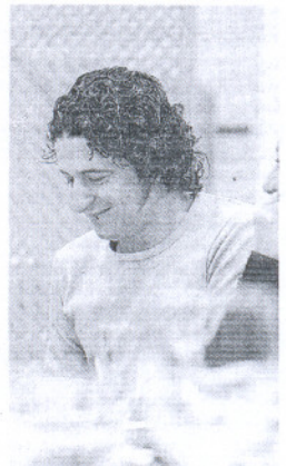
CANTAOR. Palomar.

Durante el coloquio, el artista gaditano confesó «no poder estar más de tres meses» fuera de su ciudad y recordó sus paseos por la calle Trinidad y a las personas a la que «canta». También repasó los flamencos que