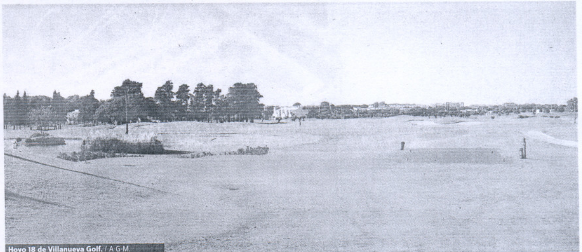
Hoyo 18 de Villanueva Golf.

Como colofón al recorrido de Villanueva Golf está este par 5. Con 448 metros desde marcas amarillas, presenta un dogleg a la izquierda de noventa grados. Desde el primer golpe hay que estar atentos al agua que tenemos a la izquierda y que acompaña al diseño del hoyo hasta el green. Si estamos en disposición de golpear duro con el driver se puede jugar ajustado al extremo del lago por encima del bunker que vemos desde el tee. Pero ojo, necesitaremos 220 metros de vuelo. En caso contrario, sea conservador y olvídense de comerse el dogleg. El segundo golpe hay que apoyarlo preferentemente en la zona derecha de la calle. El green presenta un piano en su mitad lo que nos obliga a vigilar de forma especial la posición de bandera al atacarla. Precioso hoyo.