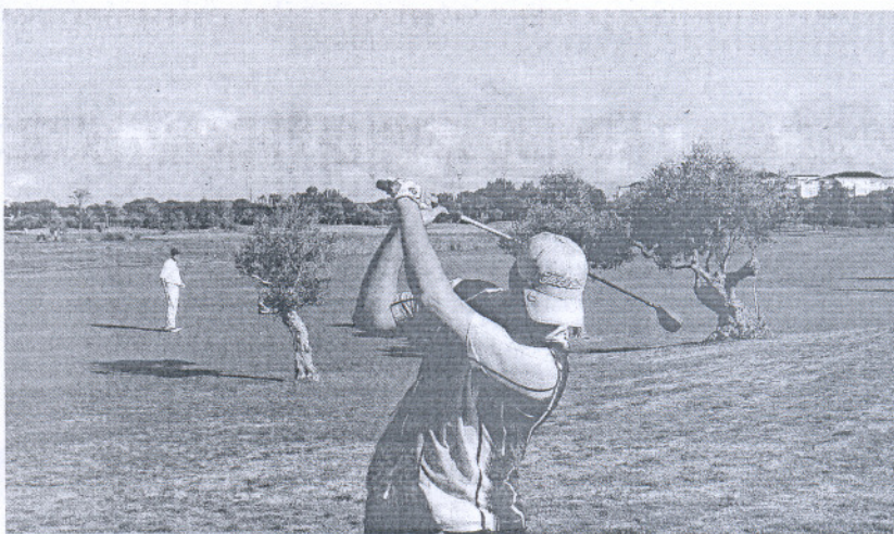
JUEGO. Los funcionarios de la ONU disfrutaron ayer del recorrido de Costa Ballena.

El derribo de esta parte se iniciará el próximo martes, de forma casi simbólica, aunque desde la empresa hotelera se afirma que los trabajos durarán más de un día. Una vez destruida la estructura del spa, Hace construirá una pérgola, con elementos móviles, para optimizar el espacio del restaurante. El retraso en la decisión de las diferentes administraciones implicadas y la crisis económica han dejado reducido, en principio, el ambicioso proyecto de talasoterapia a una ampliación del restaurante.