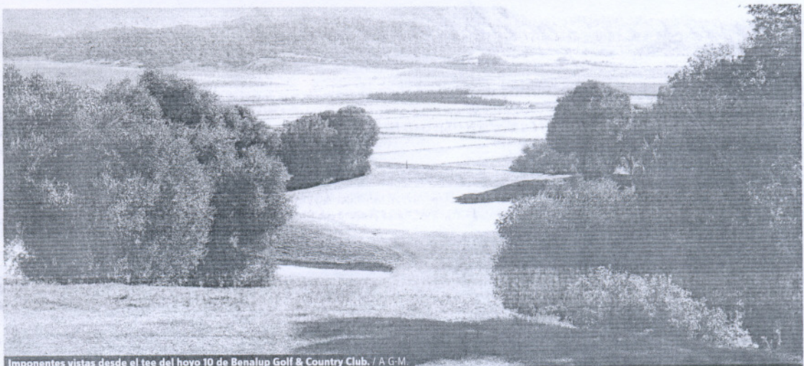
Imponentes vistas desde el tee del hoyo 10 de Benalup Golf & Country Club.

Comienza la segunda vuelta de Benalup Golf & Country Club con este hoyo que es un auténtico regalo para los sentidos. Un par 3 que no ofrece ninguna dificultad que sea digna de especial mención: salida en alto y un green amplio a tan sólo 120 metros. Pero son las impresionantes vistas que ofrece del valle de la Janda las que desvían nuestra atención del juego. Tenga pues mucho cuidado con este hazard , y si queda atrapado en él, límitese a disfrutar y a pensar en el siguiente hoyo.