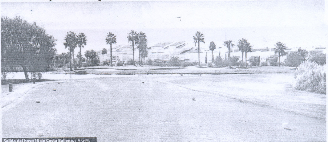
Salida del hoyo 16 de Costa Ballena.

A este precioso par tres se llega ya rondando el final de la partida. Encaramos un hoyo en el que hay que tener la cabeza fría y respirar hondo antes de golpear la bola. Merece la pena tomarse unos instantes para ello y, de esta forma, no dejarse impresionar por la gran cantidad de obstáculos que se interponen entre el tee de salida y la bandera. Agua y bunkers protegen un green no demasiado profundo y con movimiento. Siempre es mejor pasarse que quedarse corto. Téngalo en cuenta al hora de elegir el palo. Además el viento jugará un papel fundamental.