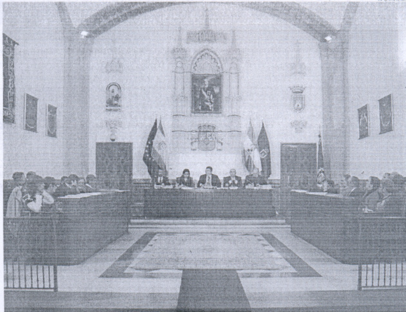
Todos los partidos políticos se felicitaron por el consenso alcanzado para mejorar las condiciones de empleo.

Este convenio se traducirá en medidas conciliadoras de la vida laboral y familiar, dotar de normas de funcionamiento a la comisión de seguimiento del convenio, o crear una comisión de Igualdad, así como en una equiparación con los sueldos establecidos para los funcionarios municipales y que se aplicará de forma progresiva, de manera que se realizará en un periodo escalonado de tres años con una paga compensatoria que sustituirá la subida correspondiente al 2008, y un incremento en un 35, 35 y 30 por ciento escalonado