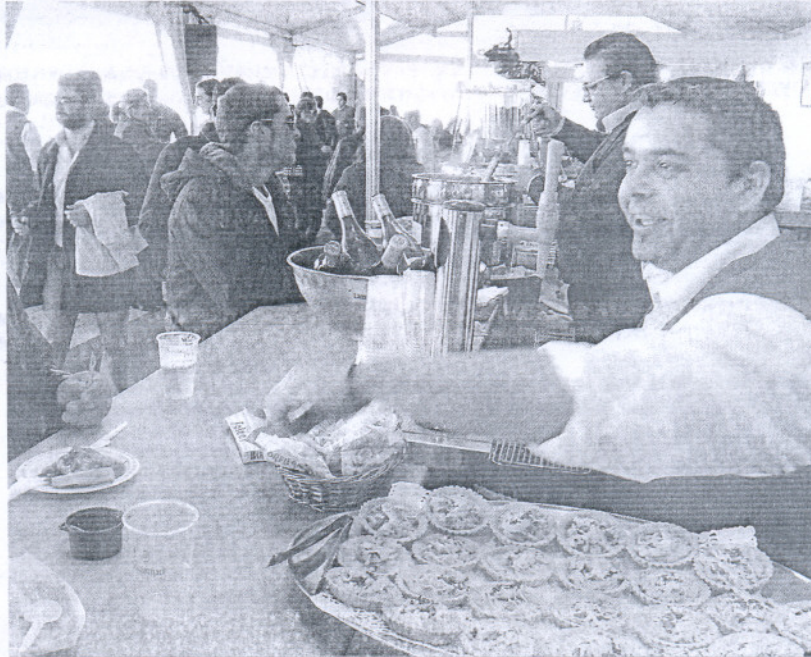
Ayer abrió el recinto habilitado para la celebración de este evento en la Avenida de la Estación.

Ocho establecimientos hosteleros de la ciudad anfitriona, uno de Rota y otro de Chipiona suman los diez negocios participantes en