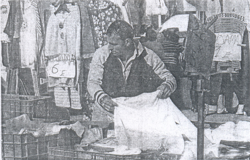
PIOJITO. Un comerciante expone su género al público en un mercadillo.

Por otro lado, Cádiz es el segundo territorio andaluz en número de clientes potenciales por cada puesto ambulante con 232, superada por Sevilla, que cuenta con 330 ciudadanos por cada punto de venta. Sin embargo, tan sólo es la quinta en Andalucía en cuanto a creación de empleo en el sector, con 10.819 puestos de trabajo, ampliamente superada por Málaga, Jaén y Sevilla, así como por Almería.