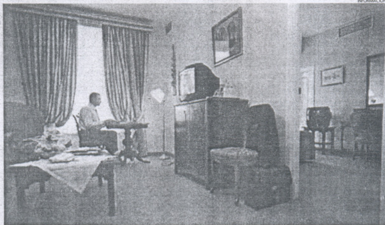
En noviembre del pasado año hubo 318.793 pernотaciones menos que las registradas en el mes anterior.

No obstante, en números totales la provincia gaditana alcanza