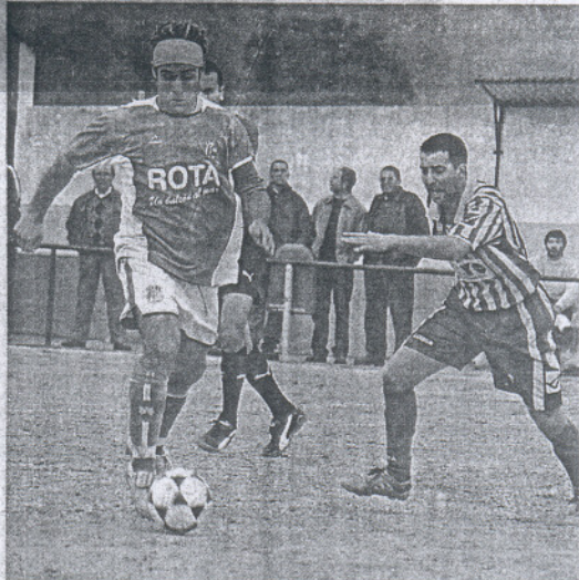
Germán conduce el balón ante un adversario onubense.