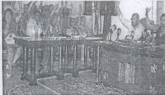
APROBACIÓN. Pleno municipal en el que se aprobó el Presupuesto de 2007, el pasado agosto.

Caro ha asegurado que esta contención del gasto «no influirá en el servicio que se le presta al ciudadano», por lo que sólo se percibirá en cuestiones como los festejos. Además, actualmente se negocian cuestiones como el