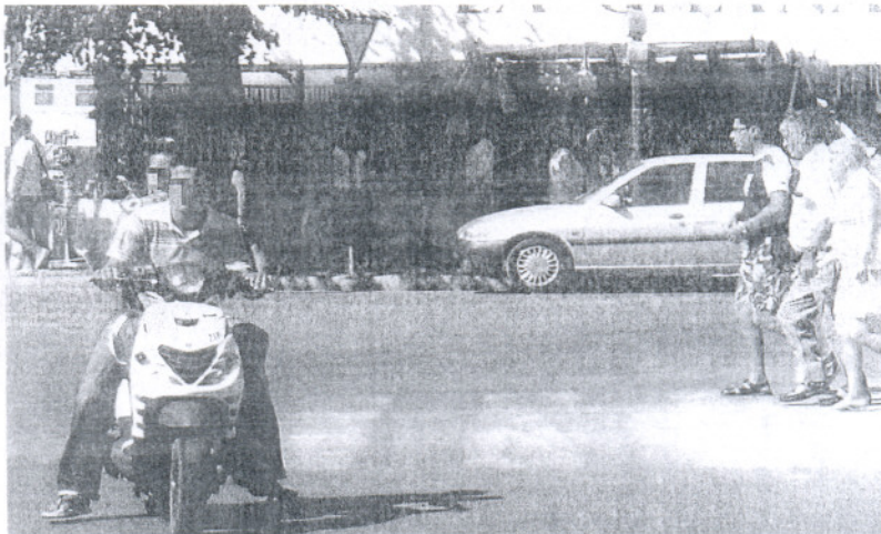
Sanlúcar y Chipiona, los municipios españoles donde menos se utiliza este elemento de protección.