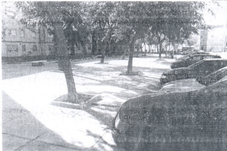
Los aparcamientos proyectados en esta barriada de alta ocupación serán subterráneos.

Centrados en el aparcamiento proyectado en esta primera fase,