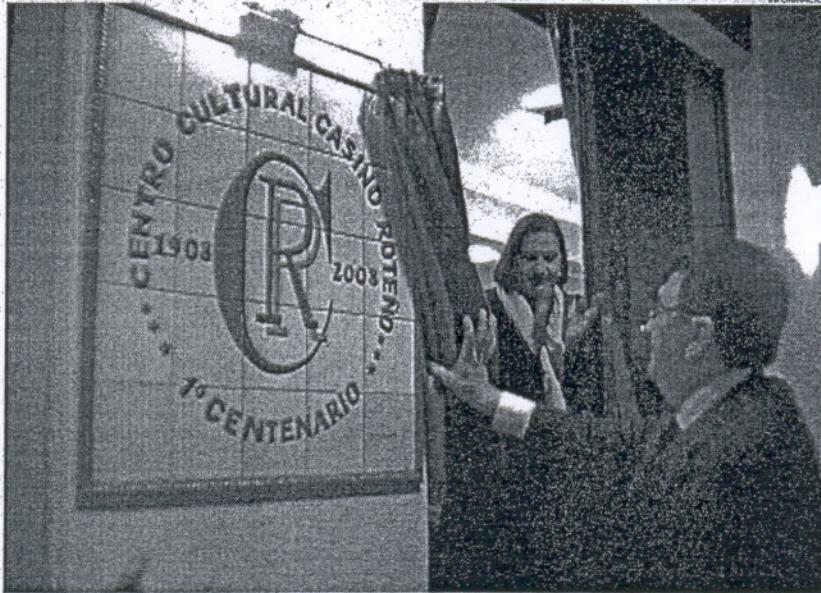
Esta placa descubierta por el alcalde de la localidad recuerda el centenario de la asociación local más antigua.