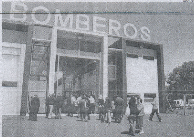
Numerosas autoridades y representantes de la ciudad acudieron ayer a la inauguración del Parque de Bomberos.