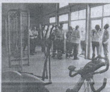
El parque cuenta con un gimnasio.

algo de lo que muchos deberían tomar buena nota.