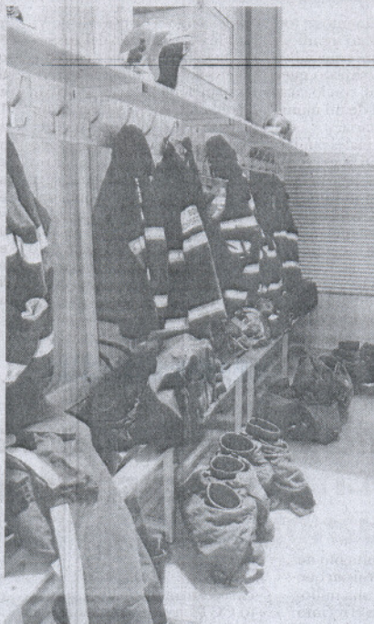
Lugar donde los efectivos guardan el uniforme.