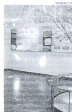
Centro de Interpretación del Litoral.

Así, se ha ensanchado la acera en uno de los laterales del Juzgado, modificando el arriate existente y en todo el frontal, se han colocado obstáculos de cemento para impedir que los vehículos al aparcar, ocupen parte de la acera. Igualmente se ha mejorado el acerado que conecta con la plaza Cibeles para que el peatón pueda caminar con toda comodidad y sin tener que bajarse a la calzada, con el peligro que ello conlleva.