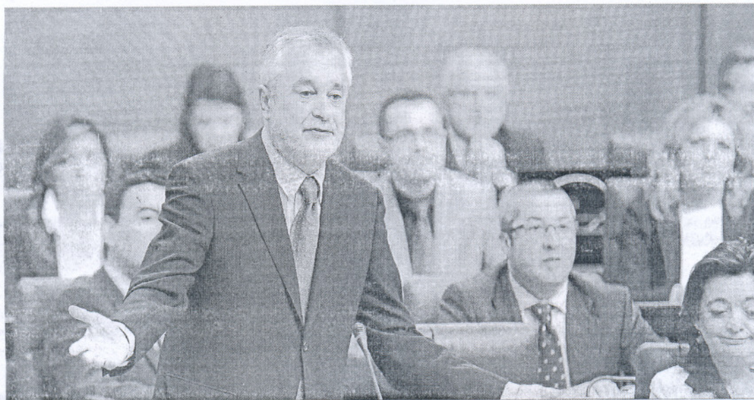
José Antonio Griñán, ayer, durante su intervención en la sesión de control al Gobierno en el Pleno del Parlamento.