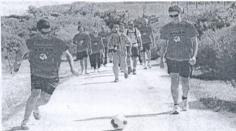
Dos de los voluntarios del 'Desafío Cruzcampo' conducen el esférico por uno de los caminos de Los Toruños.