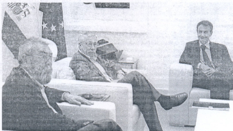
Cándido Méndez, Ignacio Fernández Toxo, y José Luis Rodríguez Zapatero, antes de la reunión en La Moncloa.

Tras el encuentro en la Moncloa, Ignacio Fernández Toxo y Cándido Méndez recalcaron que Zapatero