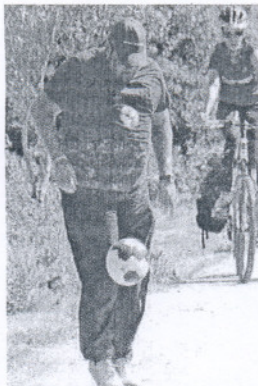
Un aficionado toca el balón.

Medio centenar de voluntarios recorrieron ayer el Parque Metropolitano de Los Toruños con el balón de la afición del Mundial 2010, que rueda por España desde que el pasado 24 de abril se pusiera en marcha en Madrid el Desafío Cruzcampo . Los Toruños fue el penúltimo desafío antes de que el balón abandone mañana la Península para cruzar el Estrecho de Gibraltar camino de Suráfrica. Alrededor de 15 kilómetros recorrió la comitiva en Los Toruños para completar el desafío número 41, que arrancó a las cinco de la tarde en la entrada del Parque Metropolitano para recorrer el Pinar de