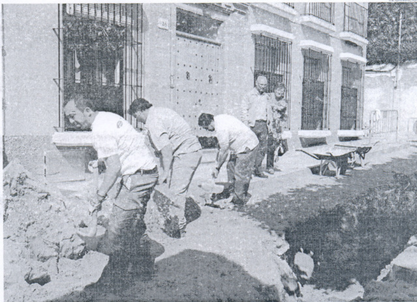
Los trabajadores que actúan en el Plan de Mejora del Adoquinado pertenecen al Plan Memta 2010.