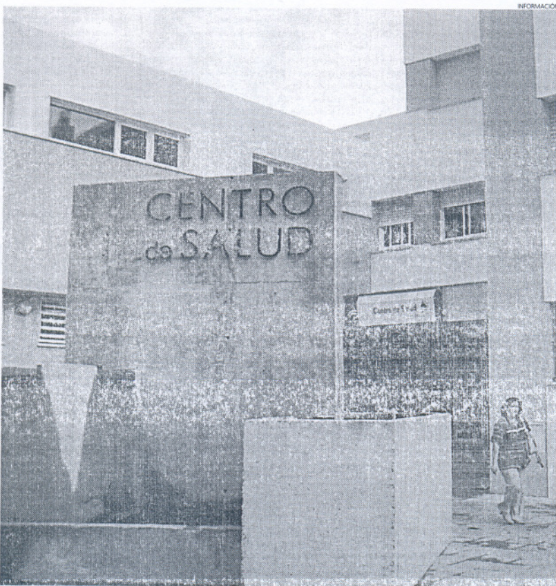
El actual centro de salud se ha remodelado en detrimento de la residencia de ancianos de la localidad.

tamiento tomó la iniciativa de iniciar este proyecto, demandado por la ciudadanía, ha esperado siempre contar con el apoyo de la Junta de Andalucía.