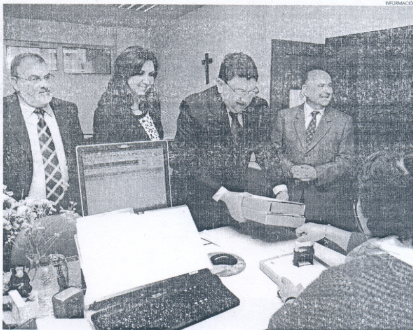
El alcalde entregaba ayer el proyecto para el nuevo centro en la sede de la Delegación Provincial de Salud.

En este sentido, el alcalde quiso destacar que desde que el Ayun-