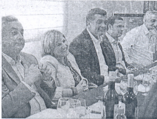
La alcaldesa, en el último almuerzo-tertulia del Círculo de Artesanos.

Entre las medidas económicas adoptadas por el Consistorio en