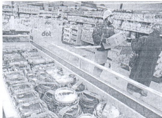
Un establecimiento de Mercadona. ANTONIO PIZARRO

Fuente: Elaboración propia. Gráfico: Dpto. de Infografía.