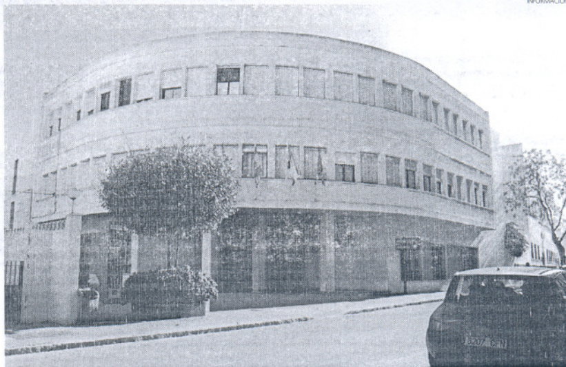
La biblioteca 'Rafael Alberti' acogerá lecturas de literatura infantil y la entrega de premios de microrrelatos.

El programa comienza el próximo martes 20 de abril con un encuentro con el exitoso escritor de literatura infantil Pepe Maestre. Esta actividad, incluida en el