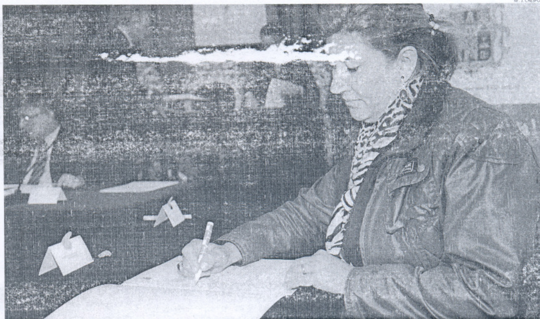
Los salones de la Diputación Provincial fueron testigos ayer de la culminación del Plan de Solidaridad Social puesto en marcha por esta institución.

El Plan de Solidaridad Social es una contribución y un reconocimiento de Diputación a los ayuntamientos, al ser las administraciones municipales las que encaran directamente con la ciudadanía los problemas agravados por