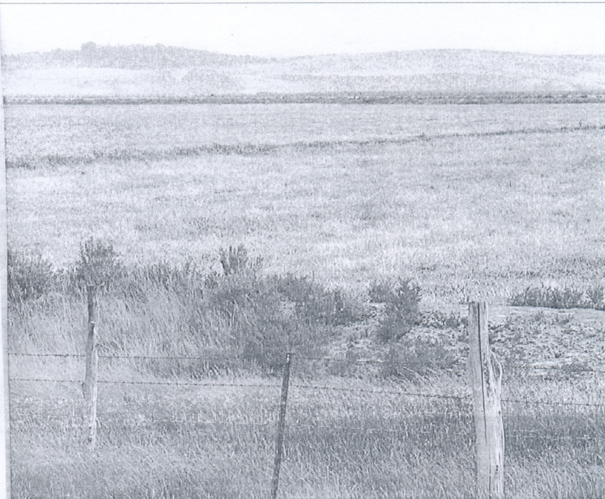
Terrenos de Gabela Honda, en Trebujena, en una imagen de archivo.

OBJETIVOS La planificación urbanística del litoral de Cádiz estará en vigor este año. Entonces, empezará el diseño del Plan de la Sierra