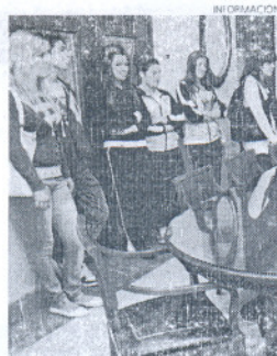
Los alumnos de PCPI.

Los seis alumnos comenzarán su formación en prácticas en diferentes departamentos municipales con una duración de 200 horas.