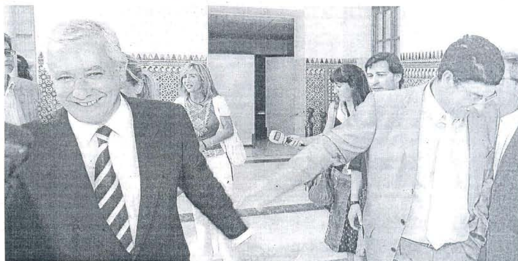
El presidente del PP-A, Javier Arenas, y el coordinador regional de IU, Diego Valderas, se saludan en el Parlamento andaluz.