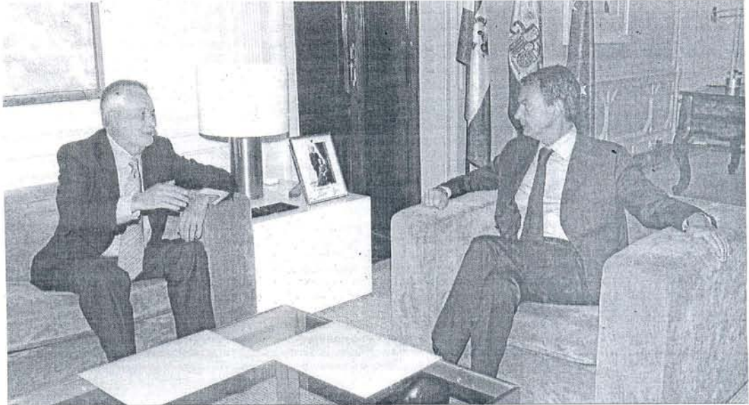
José Antonio Griñán y José Luis Rodríguez Zapatero, ayer durante su encuentro en La Moncloa.

La Junta ya tenía desde abril marcada en su agenda la puesta en marcha inmediata de un plan de calidad en el Servicio Andaluz de Empleo (SAE) para mejorar su eficacia tanto en la búsqueda de una salida laboral para el desempleado, como para su formación. Algo que en Andalucía urge, con una tasa de paro que roza al 30% de la población activa, y que deja tras de sí un millón de parados. Pero ya no lo va a hacer en solitario. En la reunión que el presidente del Gobierno, José Luis Rodríguez Zapatero, mantuvo ayer en La Moncloa con su homólogo andaluz, José Antonio Griñán, decidieron que las dos administraciones trabajarán en una reforma integral de los servicios públicos de empleo y así unificar las políticas activas y pasivas. El proyecto no tardará en echar a andar, ya que las primeras reuniones técnicas están previstas para septiembre.