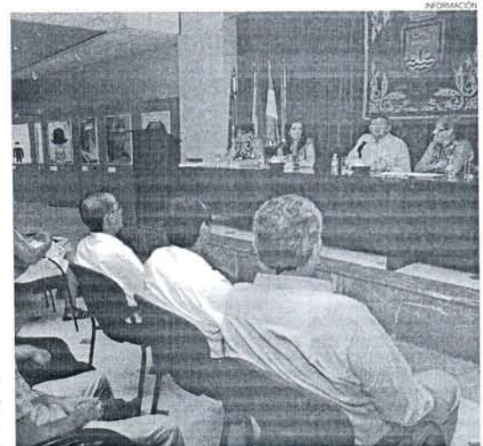
El alcalde de Rota presentó la iniciativa a los seleccionados para el centro.

de la discapacidad, con objeto de que no impida realizar las funciones a desarrollar en cada puesto, y las aptitudes de cada uno de los candidatos. La empresa arranca con la creación de diez puestos de trabajo de Notificador del Área de Gestión Tributaria; Notificador de Fundaciones Municipales; Mantenedor-Controlador de Servicios Municipales; Mantenedor-Controlador Mercado Abastos; Operarios de Limpieza Área Personal; Conserjes Administración General; Conserje de la Fundación Medio Ambiente y Playas; y Conserje de la Oficina de Atención al Ciudadano.