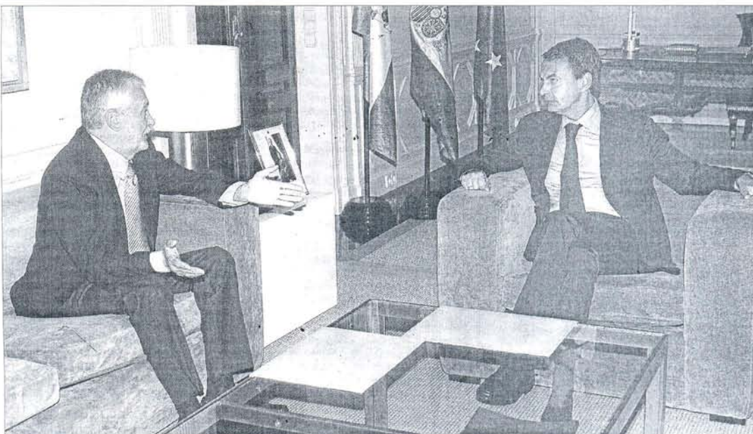
El presidente de la Junta, José Antonio Griñán, y el del Gobierno, José Luis Rodríguez Zapatero, durante su encuentro ayer en la Moncloa.