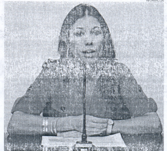
La delegada de Educación ha avanzado el programa previsto de actos.