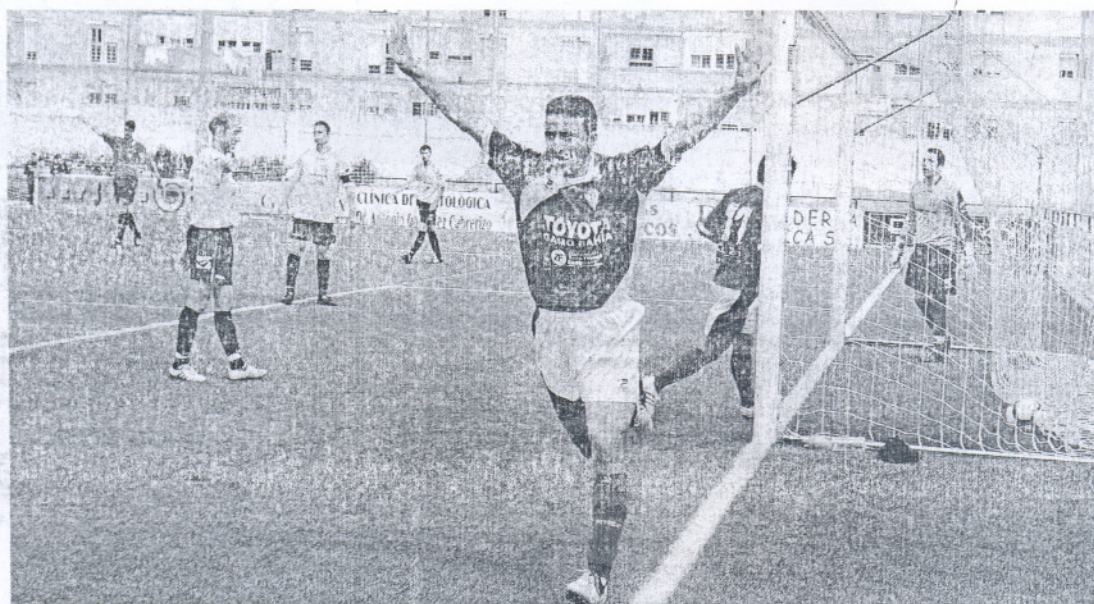
El delantero azulino Puli celebra uno de los cuatro tantos que le hizo ayer al Olont.