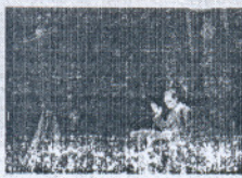
Romo triunfó en Cádiz.

Los distintos pregones abren el camino a la Semana Santa