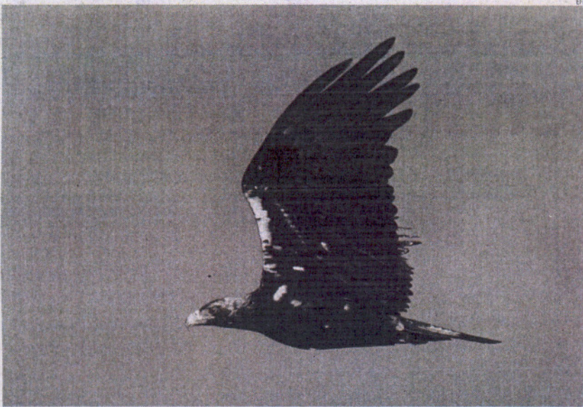
La provincia de Cádiz vuelve a tener una población de águilas imperiales.