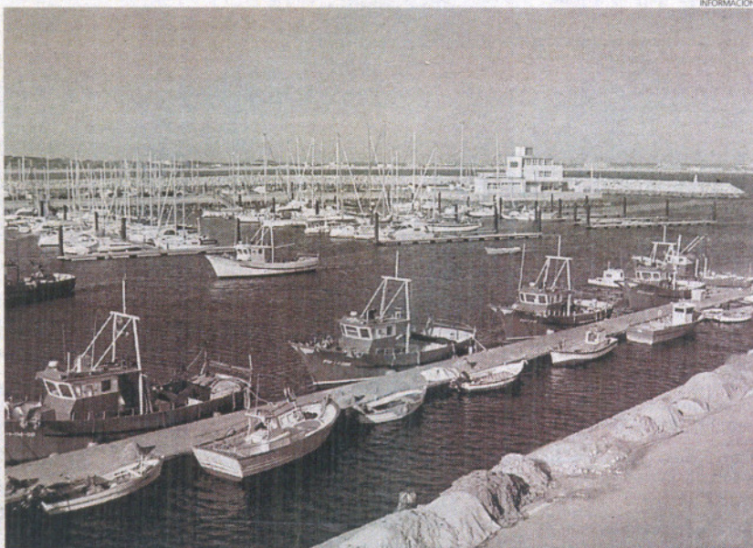
El puerto de Rota será el primero de Andalucía en contar con este punto de información al navegante y wifi.

Además de en Rota y Chipiona, estos dispositivos se instalarán en el resto de puertos autonómicos que cuentan con instalaciones náutico-recreativas gestionadas directamente por la comunidad autónoma, como son los de Ayamonte, Isla Cristina, El Terrón y Mazagón en Huelva; Puerto Amé-