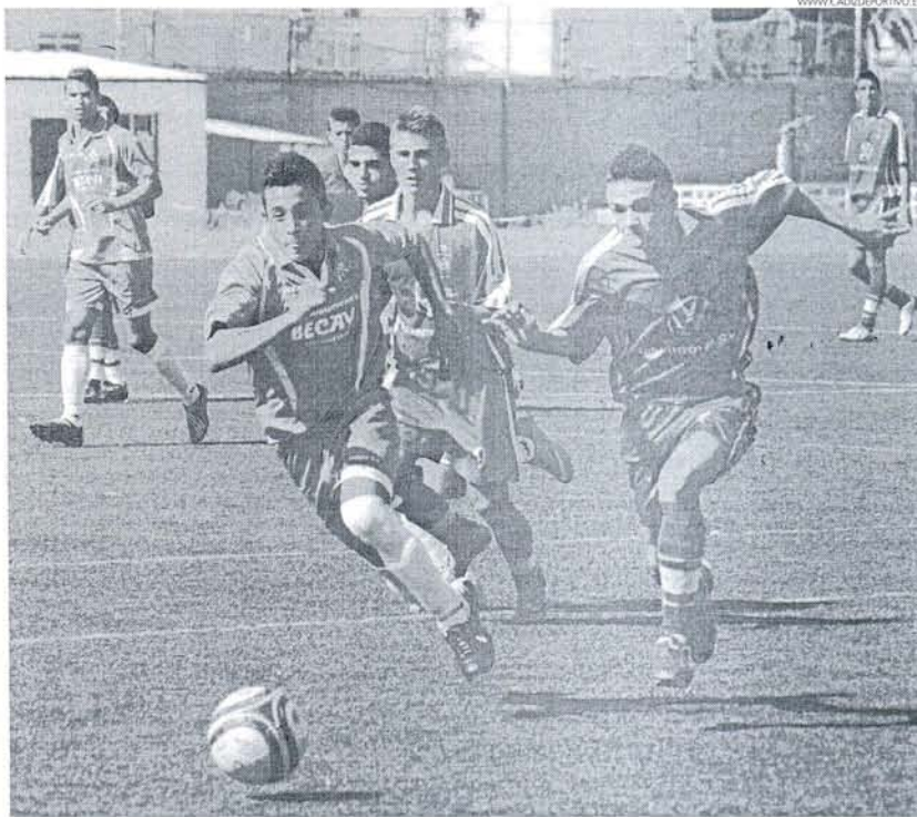
El Rota, que sigue invicto tras vencer 0-1 en Cádiz al Domingo Savio, es el líder del Grupo 1 de Primera Provincial.