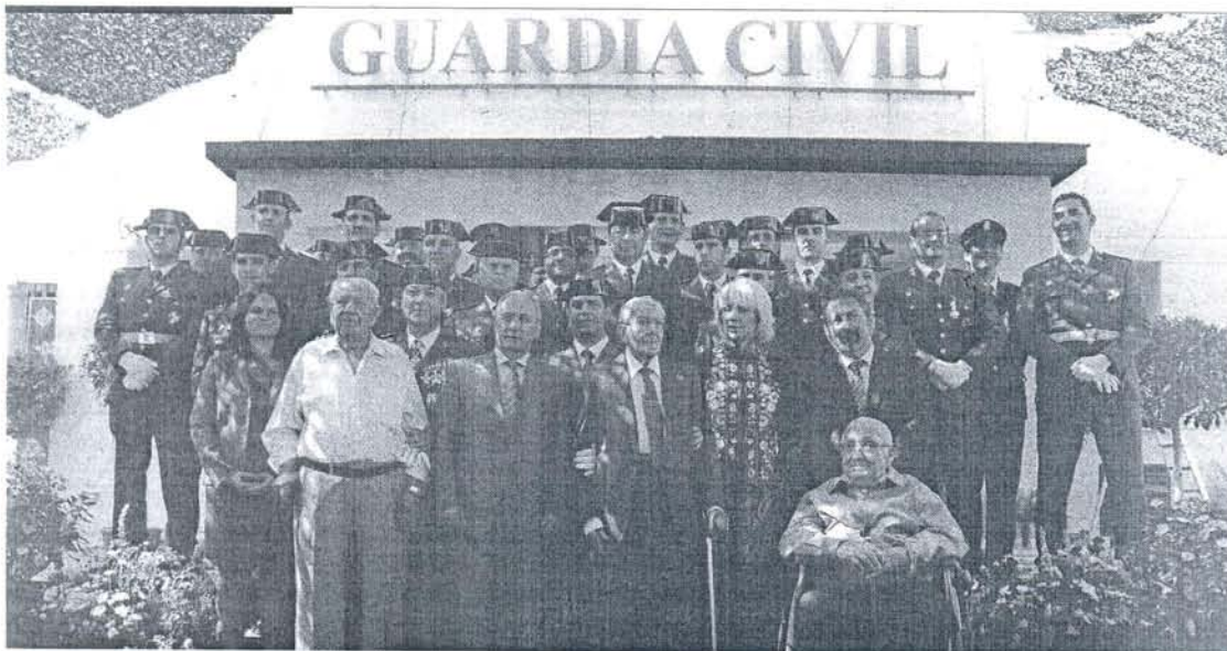
LA GUARDIA CIVIL CELEBRA EN CÁDIZ LA FESTIVIDAD DE SU PATRONA

listas del paro, según los datos registrados por el Instituto de Estadística de Andalucía (IEA). Por contra, en ese mismo periodo se lograron constituir 994 nuevas empresas. —PÁGINA 6—