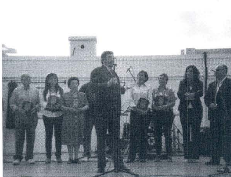
El alcalde se dirige a los vecinos durante el acto

Justo el mismo día en el que el alcalde de Rota, Lorenzo Sánchez, anunció a través de la prensa que dejaba su cargo como máxima autoridad local, por la tarde acudió a la remodelada plaza de la Hispanidad para dar por inaugurada las obras de mejora que se han acometido en este punto de Rota y tener una convivencia con los vecinos residentes de la zona.