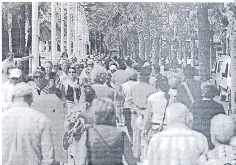
Tras la economía la clase política se sitúa como tercer problema según el 19,8 % de los encuestados.

El quinto lugar fue en septiembre para el terrorismo, que sube 3,5 puntos respecto a julio y reúne el 9 por ciento de respuestas, coincidiendo con el comunicado que ETA remitió el 4 de septiembre a la televisión pública británica recordando que llevaba seis meses sin matar. La inseguridad ciudadana y la vivienda son el sexto y séptimo problema. ■■