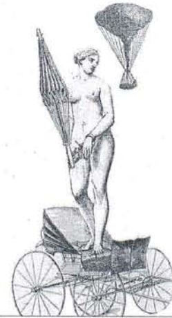
Uno de los grabados del libro.