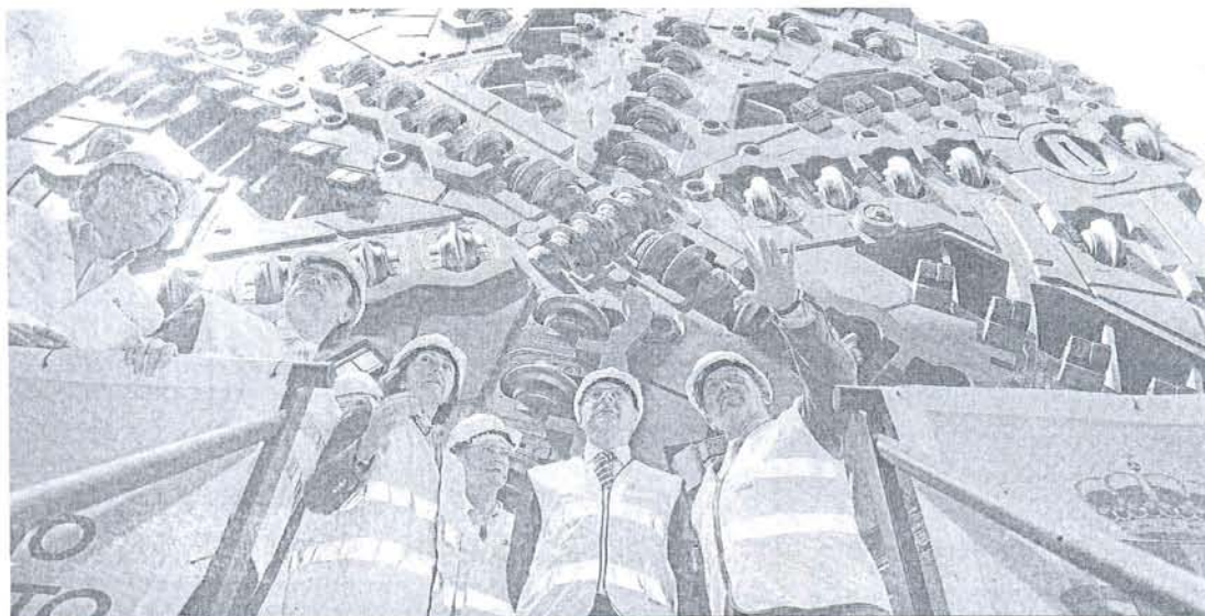
El ministro de Fomento, José Blanco, visita uno de los tramos de la futura línea del AVE Almería-Murcia.

Vincula una subida tributaria a la calidad de los servicios e infraestructuras del país • El Gobierno aún debe aclarar cómo 'atacará' a las rentas más altas