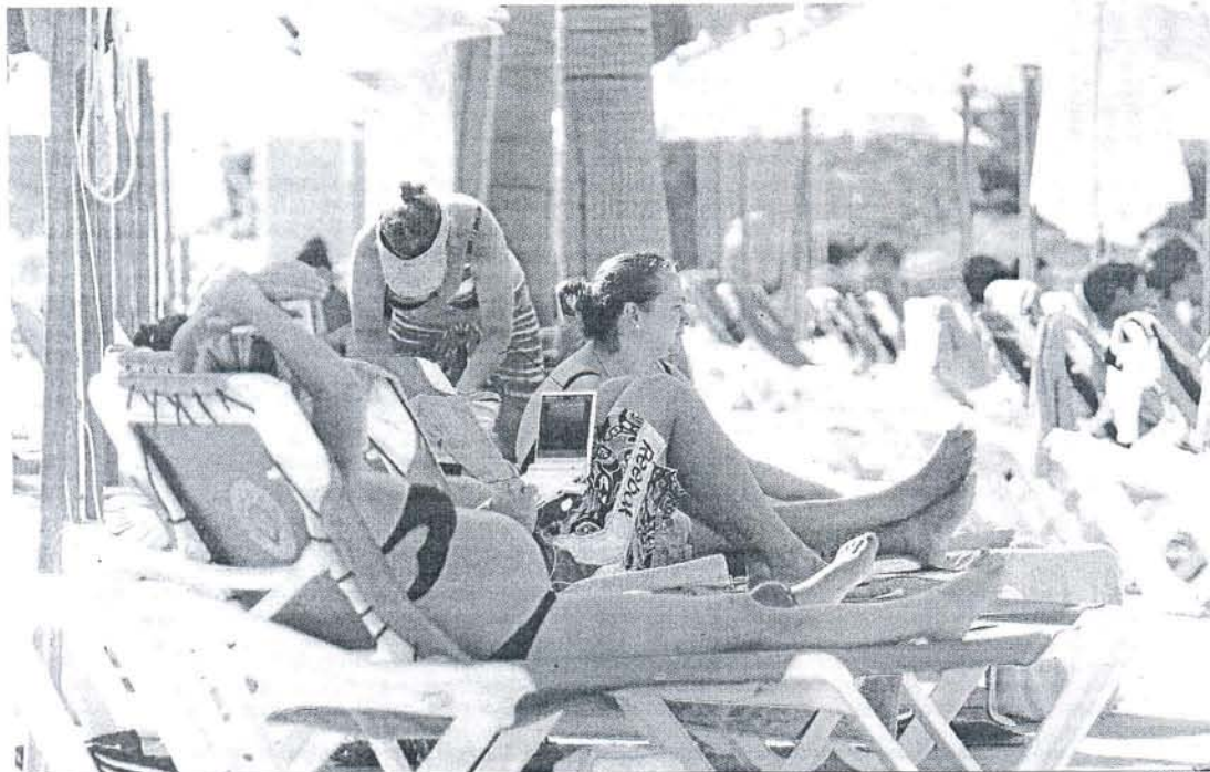
Turistas descansando en la piscina de un hotel de Chiclana durante este fin de semana.

Horeca achaca una parte de este descenso al escaso atractivo de ocio nocturno en la provincia para los jóvenes • El desplome de los alquileres veraniegos convierte 2010 en la temporada más floja en años