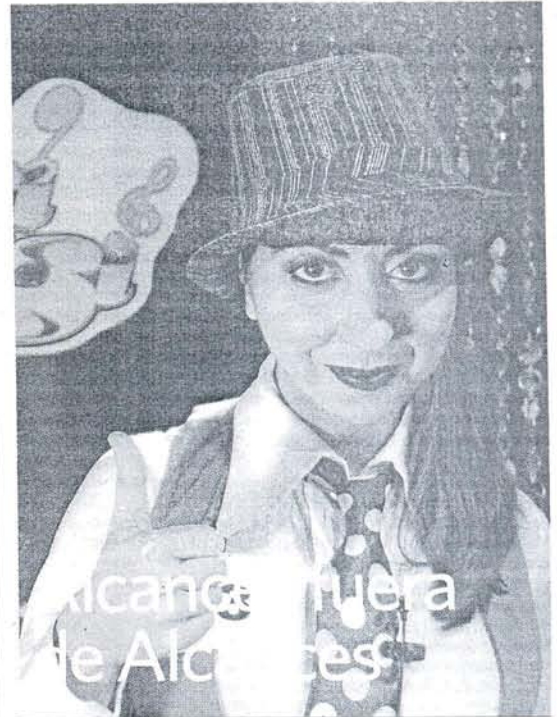
La actriz Carmen Ruiz como 'La rubia de Pinos Puente'