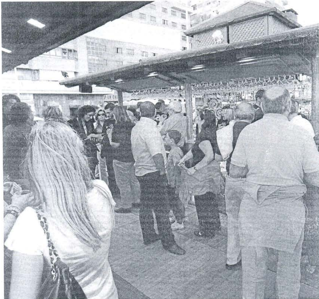
Inauguración del chiringuito de La Marea, uno de los más populares de Cádiz, en la pasada temporada de verano.

EL DATO MALO Por primera vez en años pasará la temporada estival con decenas de pisos de alquiler veraniego vacíos