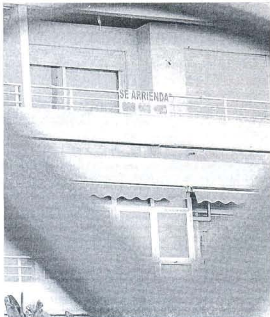
Cartel de alquiler de un piso de verano en el Paseo.