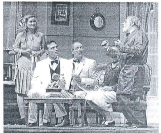
La compañía portuense, durante la representación del sábado.