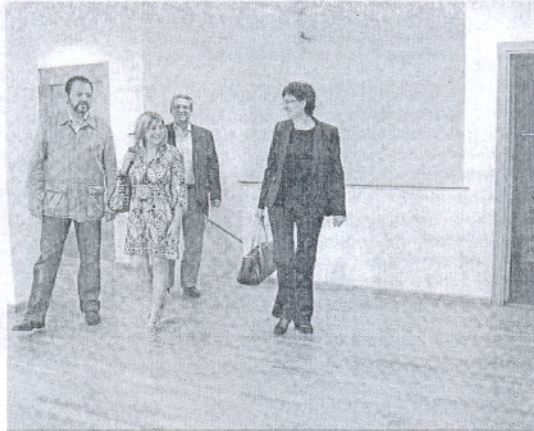
La alcaldesa visitó ayer el resultado de las obras realizadas.

Habida cuenta de que "el principal obstáculo que presentaba el edificio era la conexión entre las dos plantas", se ha instalado "un