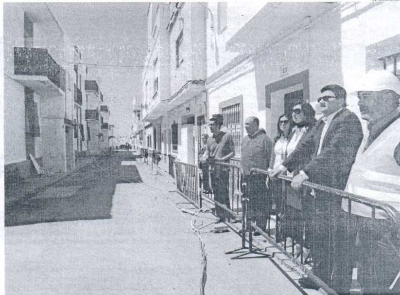
El derribo de estas viviendas procurará la construcción de un nuevo proyecto de viviendas protegidas en Rota.

Así, este proyecto que se ha desarrollado a través de la empresa municipal SURSA, permitirá, se-