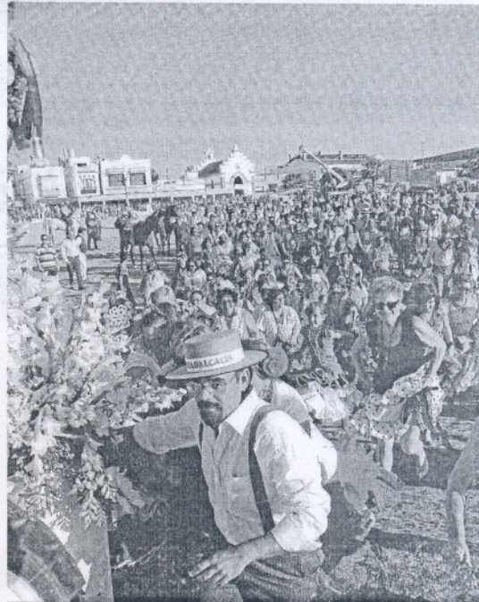
Cientos de romeros siguen al Simpecado de Cádiz, en 2009 en Sanlúcar.

Hay contabilizados 1.057 turnos de trabajo para los 580 efectivos del Plan Romero en Cádiz. La Guardia Civil, con 346, es el organismo que despliega más personas. Habrá 236 agentes del personal de la Comandancia de Cádiz, 72 del Subsector de Tráfico de Cádiz y otros 38 adscritos al Escuadrón de Caballería, al Grupo de Especialistas en Actividades Subacuáticas (GEAS) y a la Unidad de Helicópteros (UHCL).