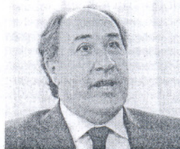
José Ignacio Landaluce.

El diputado nacional del PP por Cádiz, José Ignacio Landaluce, hizo ayer un balance preocupante de lo que la reducción en la inversión pública estatal puede originar en la provincia gaditana. En primer lugar subrayó el problema por desempleo que sufre el sur de España, "si hay menos obra pública hay menos capacidad para generar empleo". Así, advirtió que todas las obras se van a retrasar. "Miedo me da la conexión Algeciras-Vejer", elevó