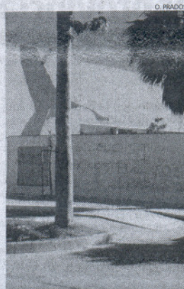
La huelga ha llegado a su fin.