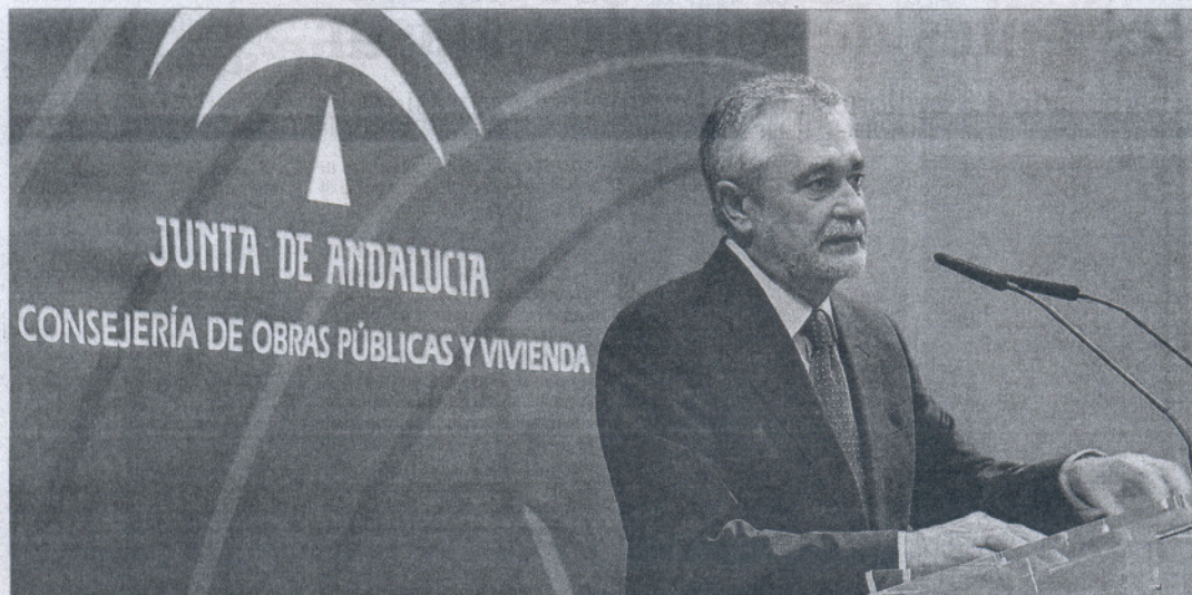
El presidente de la Junta, José Antonio Griñán, ayer, durante la presentación del plan de infraestructuras.