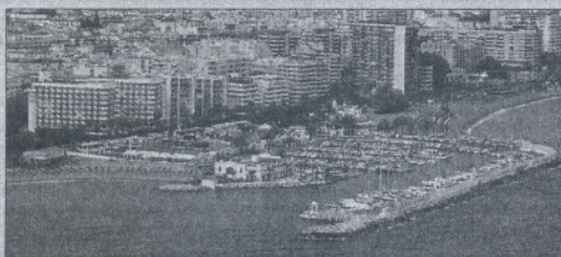
Puerto de la Bajadilla en Marbella.

► Ocho tramos de autovía: A-308, tramo Iznalloz-Darro (Granada). Autovía del Olivar: N-432-Puente Genil (Córdoba), Puente Genil-Estepa (Córdoba y Sevilla) y Úbeda-Alcaudete (Jaén). Autovía del Almanzora: Purchena-Fines-Huércal-Overa y Baza-Purchena (Almería); Autovía de la Cuenca Minera: Zalamea la Real-Ruta de la Plata (Huelva-Sevilla). Autovía A-306, entre Torredonjimeno y El Carpio. Ronda Norte de Córdoba.