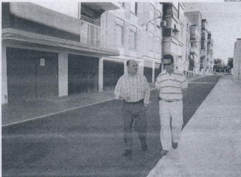
Poco a poco el entorno de la zona del nuevo centro cívico va mostrando un aspecto renovado y más moderno.

Así, en esta calle, tan sólo queda que los vecinos pinten las puertas de los garajes, de manera que todas presenten una imagen uniforme, con lo que la calle no sólo mejora en funcionalidad, sino también por la estética de todas