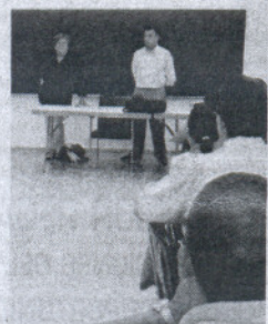
El curso es para desempleados.

ACTIVIDAD Organizado por Servicios Sociales