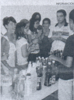
Los alumnos crearon bebidas sanas.

alcohol y a sensibilizar a la población juvenil. Además, los participantes han aprendido técnicas para preparar diferentes tipos de cócteles sin alcohol para diversas ocasiones sociales.