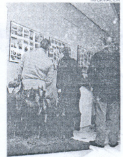
Exposición en el Castillo.