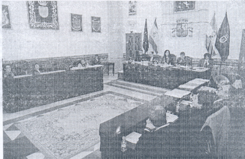
Todos los grupos estuvieron de acuerdo en que el Plan de Empleabilidad es una iniciativa necesaria en la Villa.