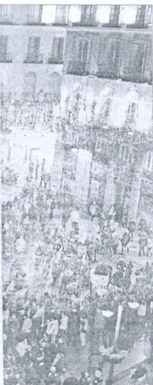
Aspecto de la manifestación ayer en la Puerta del Sol de Madrid contra el retraso de la edad de jubilación.

perfil del pensionista cercano que el del lejano. O sea, más gente mayor que joven.