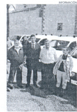
Los nuevos vehículos municipales.

El delegado de Gobernación ha querido agradecer la colaboración del Banco Santander y Solera Motor S.A., concesionario este último que se hizo con concurso.