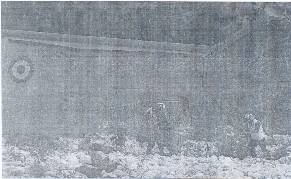
Militares participan ayer en Haití en las tareas de rescate de los cuerpos de sus compañeros, ante un helicóptero español.