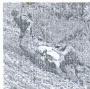
5. Tras ser localizados, efectivos españoles consiguen llegar al lugar del siniestro y recuperan los cuerpos. Éstos serán evacuados al buque Castilla y posteriormente repatriados a España.

El helicóptero pertenecía a la misión española desplegada en Petit Goave desde el buque Castilla .