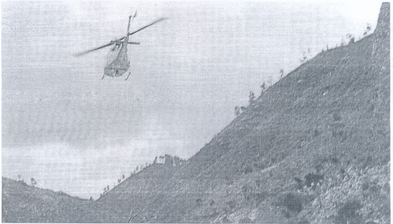
Un helicóptero de la Armada sobrevuela la zona donde el viernes se estrellaron sus compañeros.

TRAGEDIA EN LA ISLA CARIBEÑA La ministra Carme Chacón viaja a la isla para dirigir la repatriación de los fallecidos