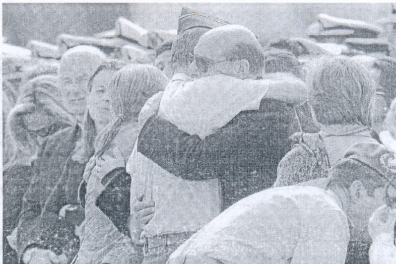
El Jemad consuela a familiares de los militares.

Chacón se había desplazado a Haití para conocer los detalles del accidente del helicóptero y