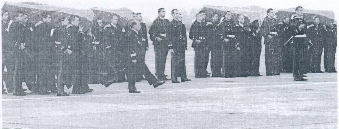
Infantes de Marina trasladaron a hombros los féretros de los cuatro militares que fallecieron el viernes en misión humanitaria en Haití.

Entre los propios familiares se daban consuelo, abrazos, ánimos, en una jornada, la de ayer, intensa y que podría concluir hoy mismo con el funeral que se celebrará a las 10.30 horas en la base de Rota y en el que han confirmado su presencia los Reyes de España, Don Juan Carlos y Doña Sofía, el