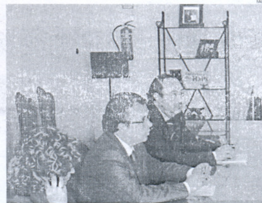
La junta de portavoces del Consistorio linense, reunida ayer.

Por su parte el Ayuntamiento de Algeciras ha trasladado sus condolencias por esta tragedia.