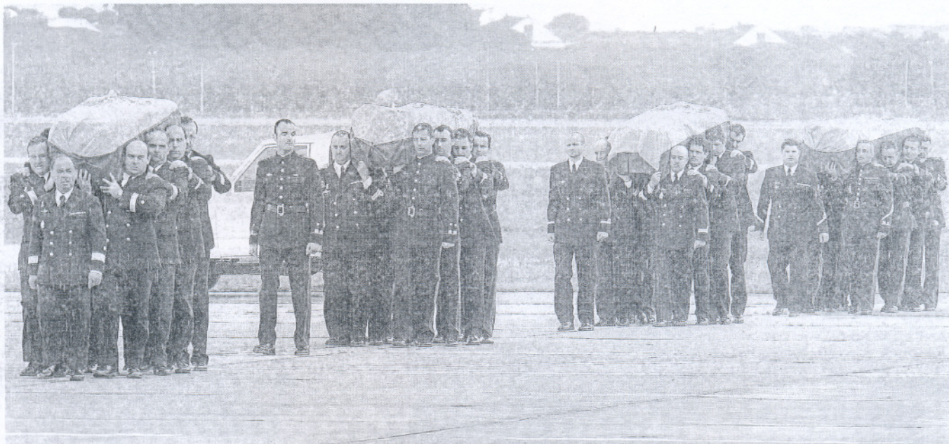
Los féretros con los restos mortales de los cuatro militares fallecidos en Haití el pasado viernes son llevados a hombros por sus compañeros de la base de Rota.