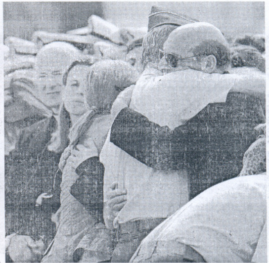
Los familiares recibieron a pie de pista los cuerpos de los militares.

Los restos mortales de los cuatro militares regresaron ayer a Rota en el mismo avión de las Fuerzas Armadas que trasladó a Haití a la ministra de Defensa, Carme Chacón. El avión con los cuatro cadáveres de los militares españoles fallecidos en Haití despegó del aeropuerto de Puerto Príncipe rumbo a España a las 19.30 horas (02:30 hora española en la madrugada del lunes), nueve horas después de lo pre-