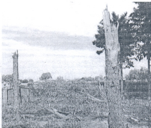
El viento fracturó de cuajo numerosos árboles. JAVIER GONZÁLEZ

Durante dos horas, un remolino de viento con ráfagas que sobrepasaron los 100 kilómetros por hora se desplazó en diagonal por el complejo turístico, hasta el antiguo tiro de Pichón, llevándose por delante invernaderos, árboles y tejados. La alarma se desató al filo de la una y cuarto de la madrugada, cuando el tornado comenzó a cebarse con la parte chipionera de Costa Ballena y diseminados cercanos como la