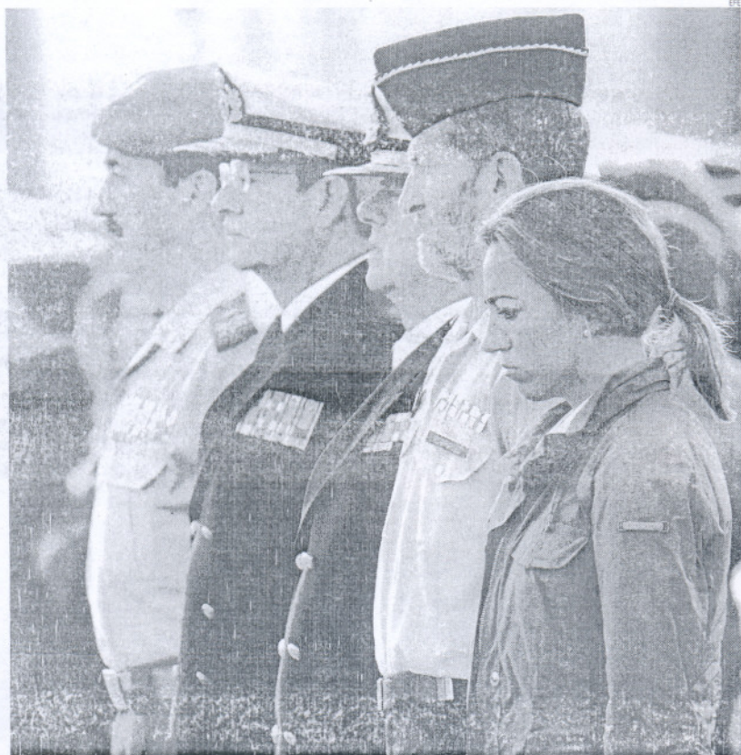
La ministra de Defensa, Carme Chacón, regresó de Haití y ayer estuvo consolando a los familiares en la base.

Instituto Anatómico Forense de Cádiz, donde se realizó una autopsia y pruebas para confirmar su identificación.