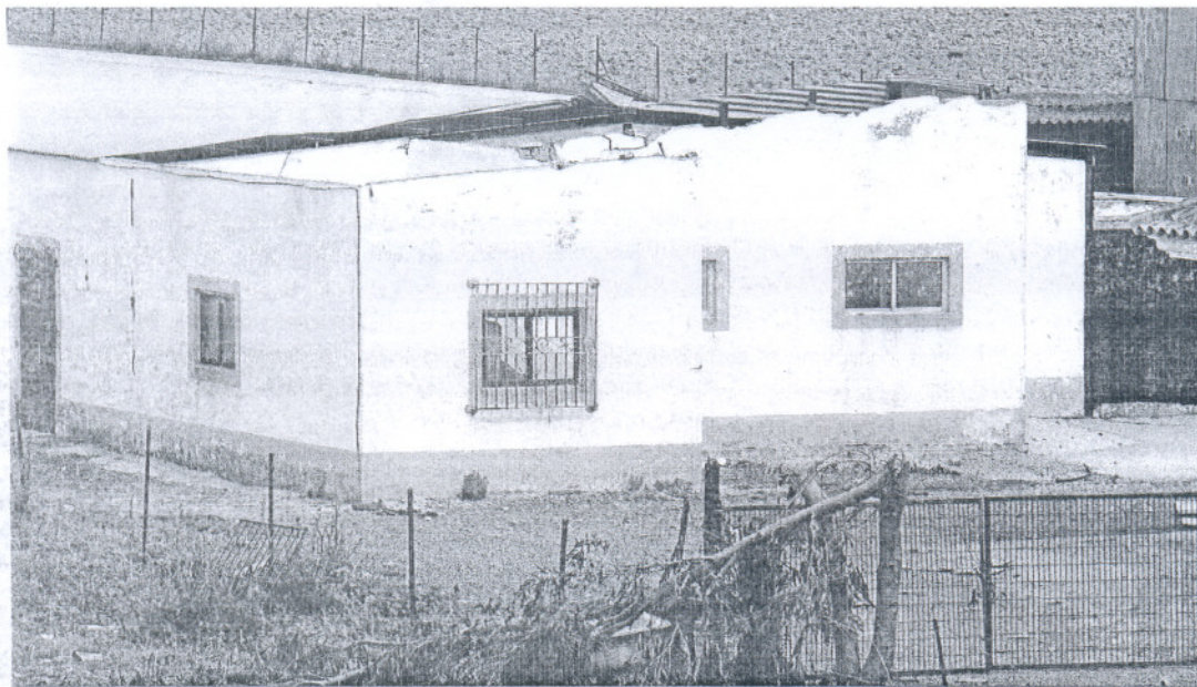
El tornado arrancó varios tejados, como el de esta vivienda, emplazada en uno de los diseminados cercanos a Costa Ballena, en Chipiona. JAVIER GONZÁLEZ