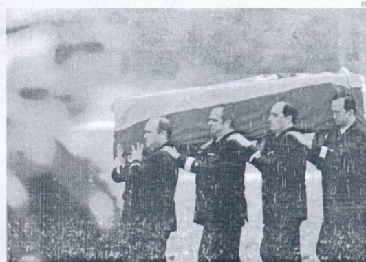
Hoy tendrá lugar el funeral por las cuatro víctimas.

Con este gesto, el Gobierno quiere dejar constancia del "dolor de la Nación española" por la muerte de los cuatro militares que formaban parte del contingente español en la operación de apoyo humanitario en Haití.