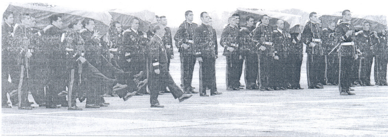
Los féretros con los restos de los cuatro militares muertos en Haití son llevados a hombros por sus compañeros a su llegada a la base de Rota en la mañana de ayer.

45 LA CEREMONIA RELIGIOSA SE CELEBRARÁ A LAS 10,30 DE LA MAÑANA DE HOY EN LA BASE DE ROTA