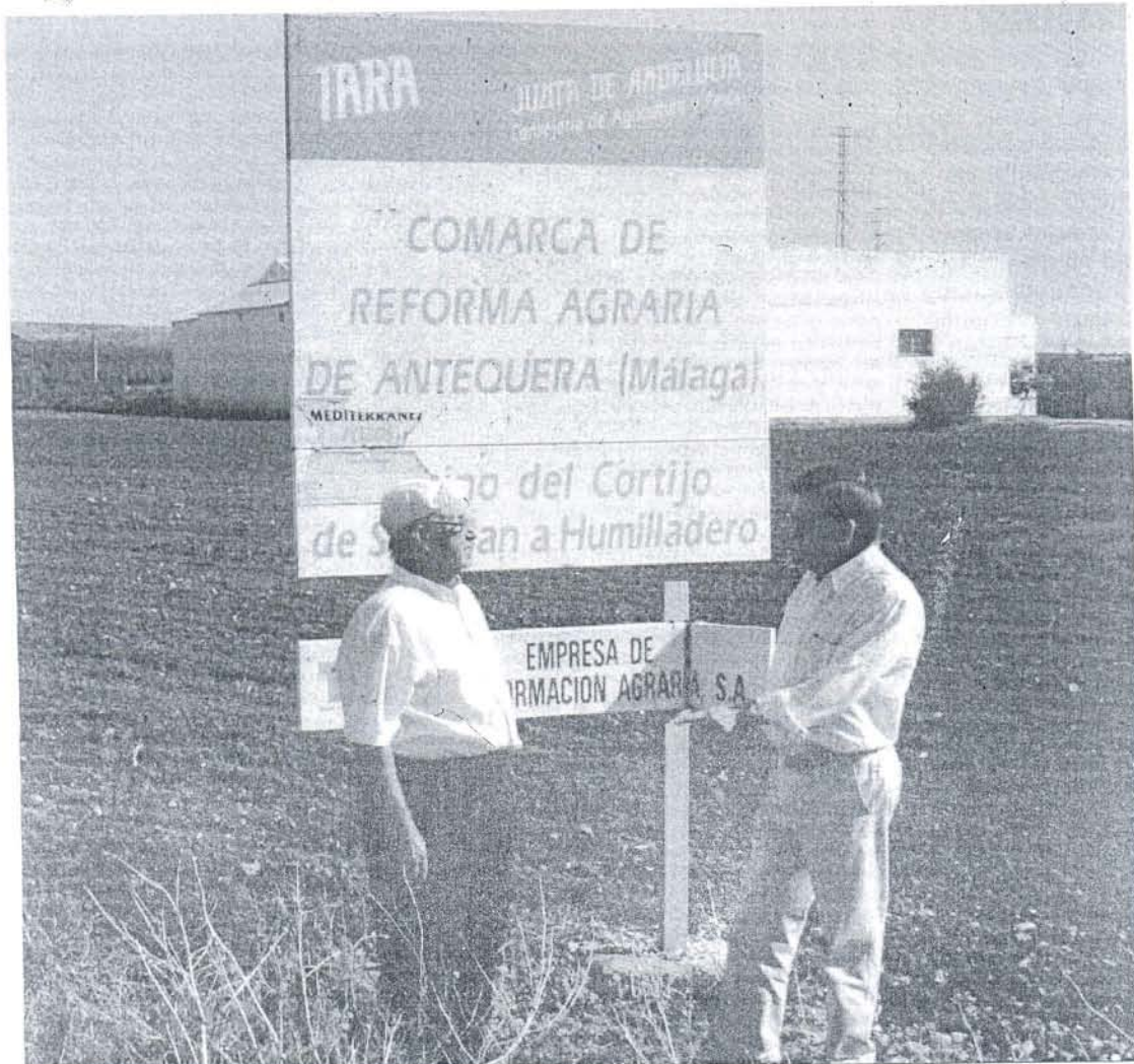
Dos agricultores posan en terrenos del IARA en la que fue la zona más polémica de la ley, Antequera, en Málaga.

LA RESPUESTA Los grandes propietarios llegaron a presentar hasta 6.000 recursos para bloquear la reforma agraria