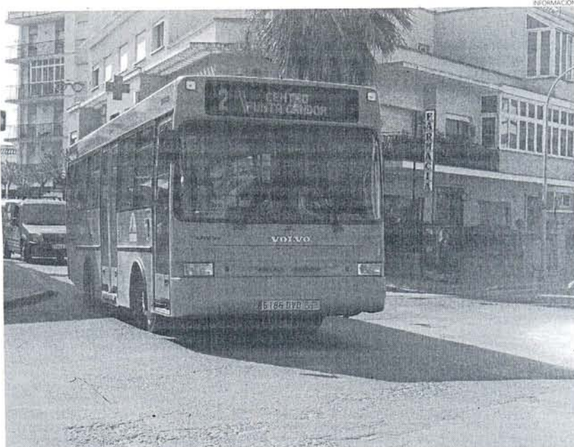
El servicio de autobuses urbanos de Rota es muy usado por sus ciudadanos, pero el PSOE critica su déficit.

Pero no solamente existe este incumplimiento, denuncian los socialistas, sino que además, "el equipo de Gobierno, con su alcalde a la cabeza, también es responsable de que durante los años