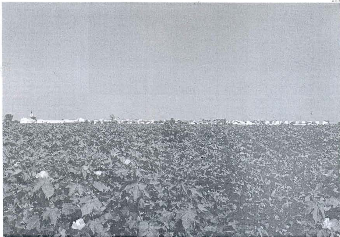
El Poblado de Doña Blanca se encuentra rodeado de explotaciones agrícolas sembradas de algodón de máxima calidad.