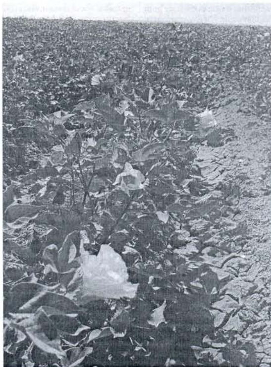
Las plantas de algodón ya están floreciendo en las tierras portuenses.

Otro cultivo que no ha ido mal ha sido el girasol, que ya se ha comenzado a recolectar.