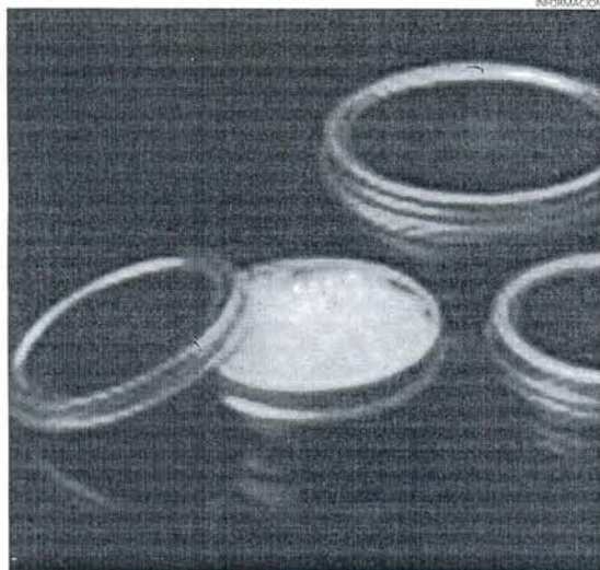
Se trata de un manjar que no surge del pescado sino de los caracoles.

Según explica Hervías, el caviar blanco son huevas de una especie de caracol ( Helix aspersa ) que tie-