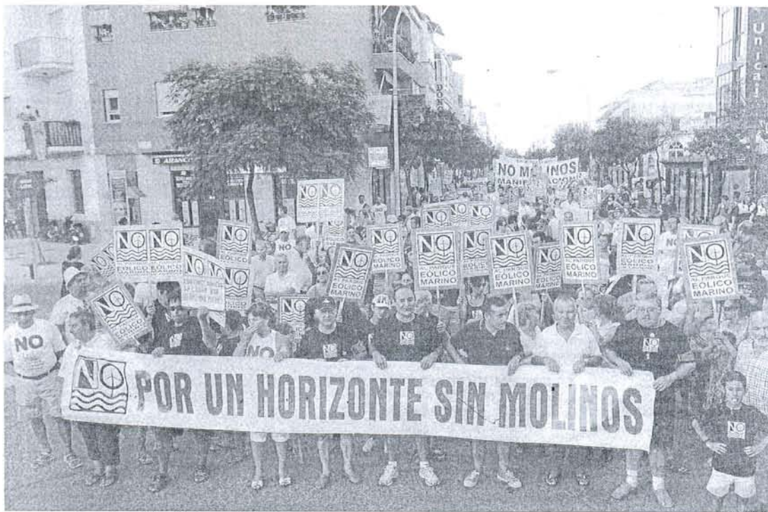
La marcha contó con la participación de un nutrido número de personas.

Por parte del Ayuntamiento de Rota estuvieron presentes en la