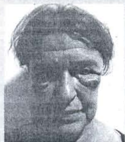
Así quedó una de las activistas.

Abandonan el Sáhara los españoles agredidos por la policía marroquí