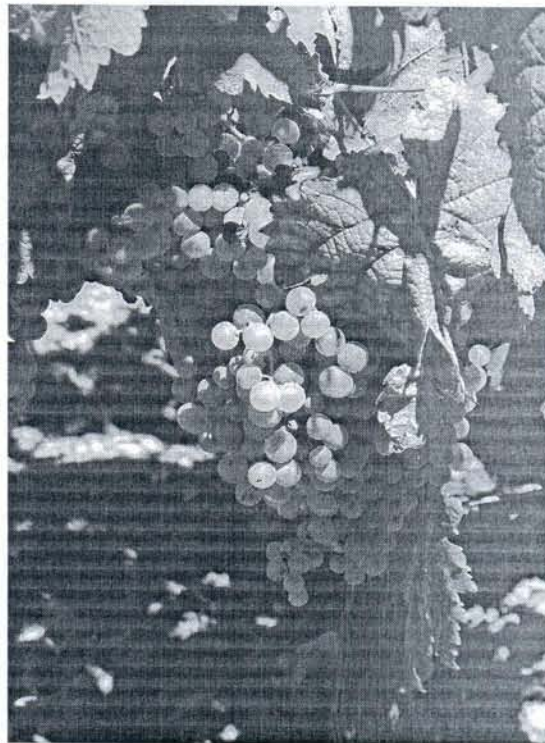
Las vides portuenses están cuajadas de racimos de uva.

De cualquier forma, estos excedentes no se verán este año muy afectados en cuanto a aumento de volumen dado que se espera una vendimia muy similar a la del año pasado, que se cuantificó en 74 millones de kilos, muy por debajo de campañas anteriores en las que no se bajó de los 90 millones de kilos. Las enfermedades sufridas por la uva en la pasada primavera han sido un factor determinante en la reducción de la producción.