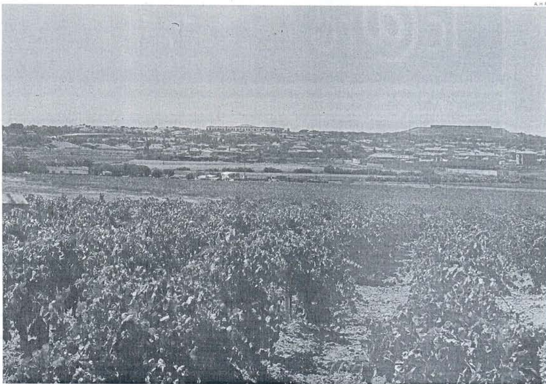
En el término municipal de El Puerto de Santa María hay unas 1.000 hectáreas dedicadas al cultivo de la vid.

que el viñedo del Marco de Jerez ha llegado a una "situación crítica" en la que se acumulan las pérdidas, "sobre todo entre los viñistas independientes", que no es atractiva para las nuevas generaciones de agricultores.