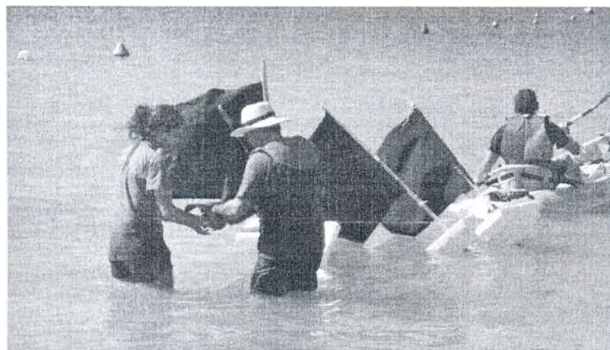
Elon borne de ecologistas se disponen a colocar las banderas negras flotantes

Ecologistas en Acción de Rota colocó en la mañana de ayer sábado 28 de agosto cuatro banderas negras en la costa roteaña a modo de protesta ante la contaminación de las aguas debido a los vertidos residuales y a la consiguiente desaparición de cebadales (praderas de fanerógamas marinas que sirven de ecosistema para muchas especies de peces).