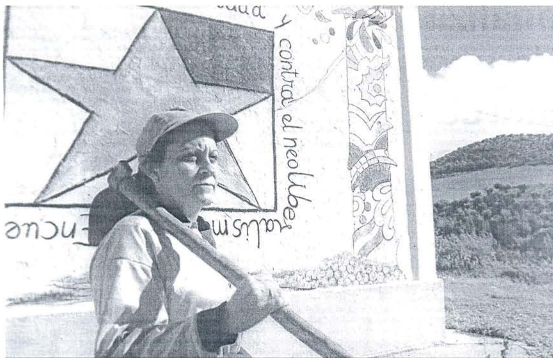
Mural que en 2002 anunciaba la cooperativa El Indiano, en Puerto Serrano, que creció en tierras del IARA.

Apenas queda en la provincia un centenar de colonos que en los 80 lograron la concesión para cultivar la tierra • El IARA desaparecerá y Asaja cree que "nadie derramará una lágrima por este anacronismo"