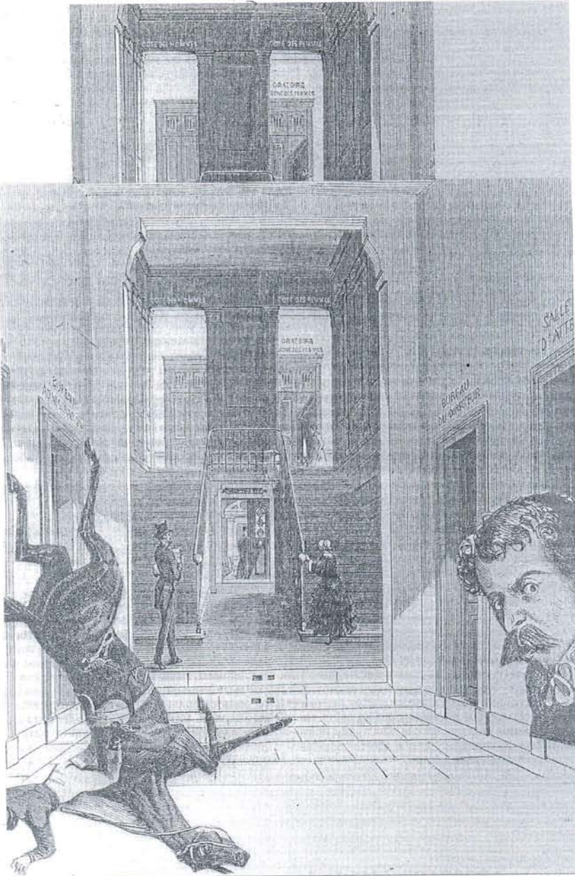
Uno de los 'collages' del libro: algo así pasaría si se organizara una carrera de caballos en una vieja biblioteca.

Al hablar de este tipo de libros, al narrador, poeta y ensayista le resulta "inevitable mencionar a Max Ernst". "Sus novelas en imágenes—dice—son uno de los puntales del collage. Es un referente inexcusable, sobre todo si uno trabaja con imágenes decimonónicas, como es mi caso". Tal como concibe él mismo un buen collage, éste "debe ser escueto". "No conviene abusar de los elementos,