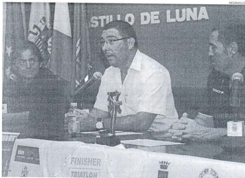
La Triatlón se convierte en una de las citas más esperadas del verano y con mayor participación.

Las inscripciones se han podido hacer este año a través de internet, un sistema mucho más rá-