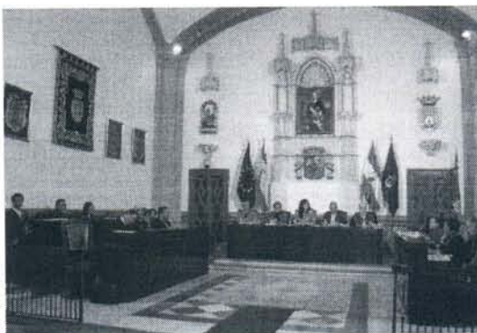
Concejales del Ayuntamiento durante una sesión plenaria

El pleno celebrado en la mañana de ayer jueves no aprobó la moción que el PSOE presentó buscando consenso para poner en marcha un plan de pagos a proveedores del Ayuntamiento de Rota. De hecho, la propuesta socialista sólo consiguió el apoyo del grupo municipal de Izquierda Unida, insuficiente para sacarla adelante ya que Partido Popular y Roteños Unidos volaron en contra.