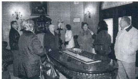
Mayores en el Castillo de Luna durante la ruta cultural.

Ayer miércoles, tocó el turno de conocer a fondo la localidad desde un punto de vista cultural. Así, los asistentes a la ruta "Conoce tu pueblo", pudieron visitar la parroquia de Nuestra Señora de la O, el Palacio Municipal Castillo de Luna o el museo Zoilo Ruiz Mateos.