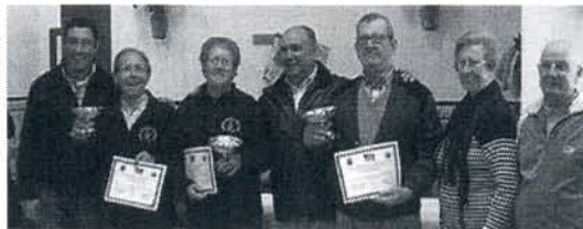
Ganadores del campeonato de Petanca junto a los delegados.