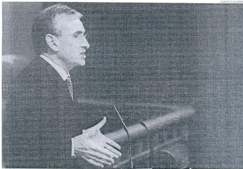
El ministro de la Presidencia, Ramón Jáuregui, fue el encargado de defender la prórroga del estado de alarma.

Para el Gobierno, la mera incertidumbre representa "un coste inasumible para el país" y mien-