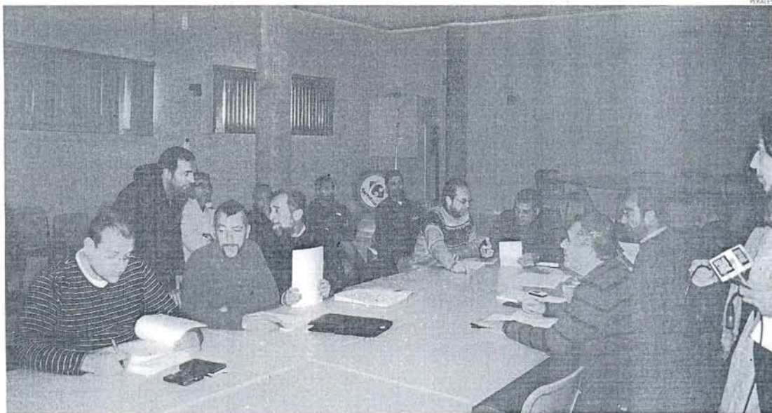
El encuentro con los medios de comunicación sirvió para escuchar la versión de los ex trabajadores sobre distintas informaciones divulgadas.

"La Administración debe tener una información veraz y transmitirla", señala el colectivo. Y es que los 100.000 euros de media que dijo el consejero de Empleo que recibieron los ex de Delphi, "es, además de mentira, una provocación". Y es que esa indemnización recayó en una minoría de altos cargos con "muchos años de antigüedad". De los 585 ex trabajadores, 4 recibieron 50.000 euros; 85, 40.000 euros; 159, menos de 30.000; 71, menos de 20.000; y el resto, unos 10.000 euros. Además "hay 178 compañeros que eran eventuales no han cobrado ni un céntimo". Y para más inri, "las indemnizaciones nos las pagó la empresa y estaban establecidas según la ley", con lo cual, "la Junta debería callarse". También esgrimieron las razones por las que se habló de un porcentaje de absentismo del 10 por ciento que en realidad era del 3 por ciento porque "contaban incluso los fines de semana".