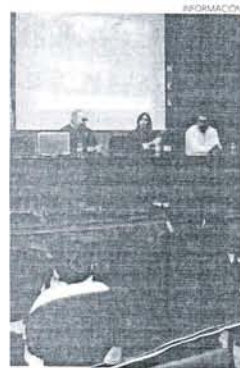
Presentación de la iniciativa.

Las actividades prosiguen el jueves día 16 con una excursión de carácter cultural a la ciudad vecina de Jerez de la Frontera; el viernes a las siete de la tarde será la tradicional zambombá.