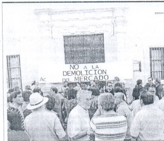
Una de las protestas convocadas por Aula Gerión contra el proyecto.

En cuanto a las obras proyectadas en el actual edificio, Prats expresó sus "dudas" sobre "si la Junta de Andalucía tiene realmente el dinero necesario para llevarlas a cabo". Igualmente, preguntó