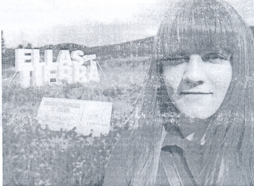
Como cada año, la Diputación Provincial se volcará con los actos del Día internacional de la Mujer.

El grupo 'El Hijo de la Luna' con la obra Los colores de la mu-