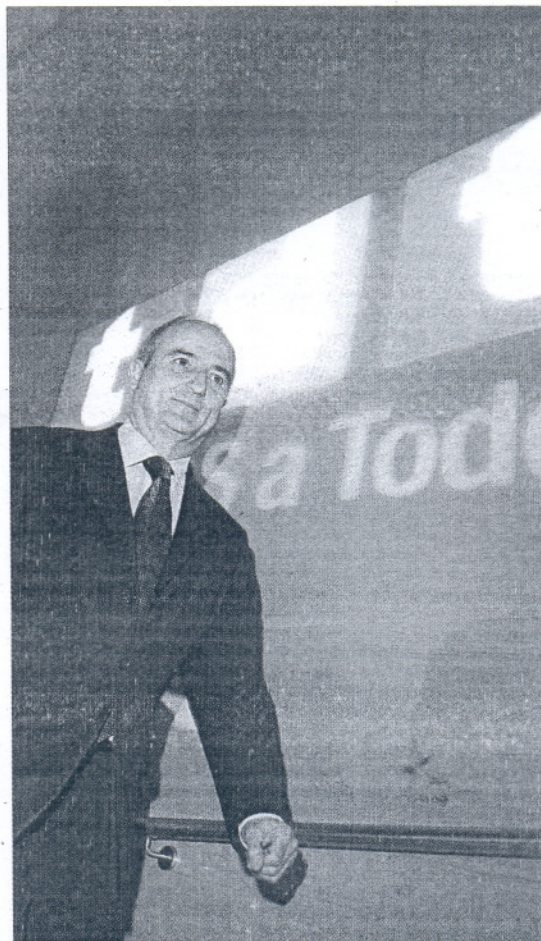
El ministro Sebastián la semana pasada en el acto del 'encendido digital'.

El hecho es que está quedando impune la parsimonia de la Junta a la hora de desarrollar, aunque sea mínimamente, ese mapa idílico de