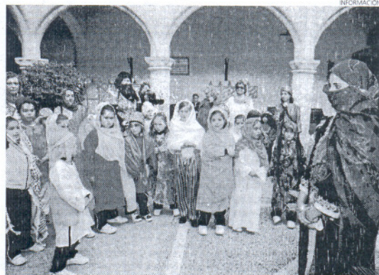
Los escolares, disfrazados de árabes, recorrieron el Palacio Municipal.

la localidad a través del Castillo de Luna. La investigación de estos escolares concluía con una prueba interactiva haciéndoles preguntas y pruebas para asegurarse de que es cierta toda la información. La delegada de Educación acompañó a algunos escolares en su visita, manifestando que con esta actividad educativa se fomenta el conocimiento del patrimonio e historia roteña y andaluza.