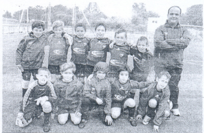
Los benjamines de la Roteña B perdieron en Sanlúcar.