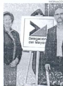
El nuevo logo de los Mayores.

Al mismo tiempo, el edil ha anunciado que desde la Delegación del Mayor ya se trabaja para crear, además del logo, un eslogan propio para la citada Delegación.