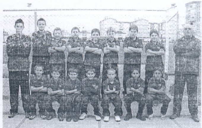
La Roteña A benjamín lo tuvo muy fácil ante el último clasificado.