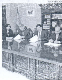
El alcalde firmó el contrato.

Está prevista la apertura de una nueva oficina de atención al cliente, entre otras mejoras.