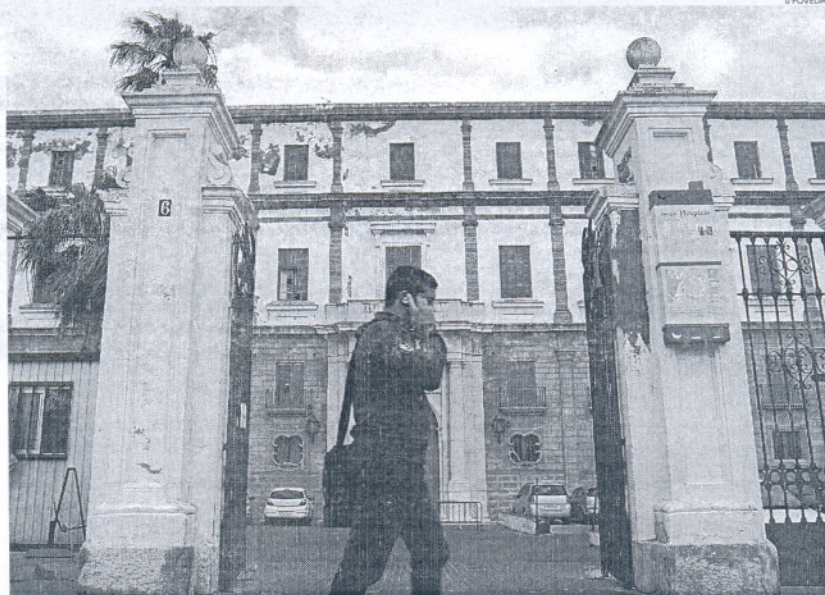
La Escuela Fernando Quiñones, actualmente en Valcárcel, se trasladará al Instituto del Rosario.

Se trata de un requisito indispensable para la Diputación, que necesita saber si el hotel comenzará a construirse en "dos, tres, cuatro o cinco años", para a partir de entonces negociar las condiciones del convenio original que firmaron las dos entidades. "Hay que renegociarlo, porque en el convenio figuraban unos plazos que ya están vencidos, y por tanto, hay que acordar otros diferentes", explica el di-