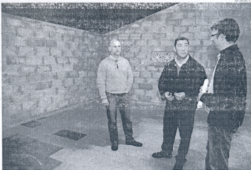
Los delegados de Deporte (centro) y Servicios Municipales (I) visitaron las instalaciones de la Escuela de Vela.

Así, esta actuación tiene por objeto mejorar las instalaciones del edificio y reparar o sustituir aquellas que se encontraban deterio-