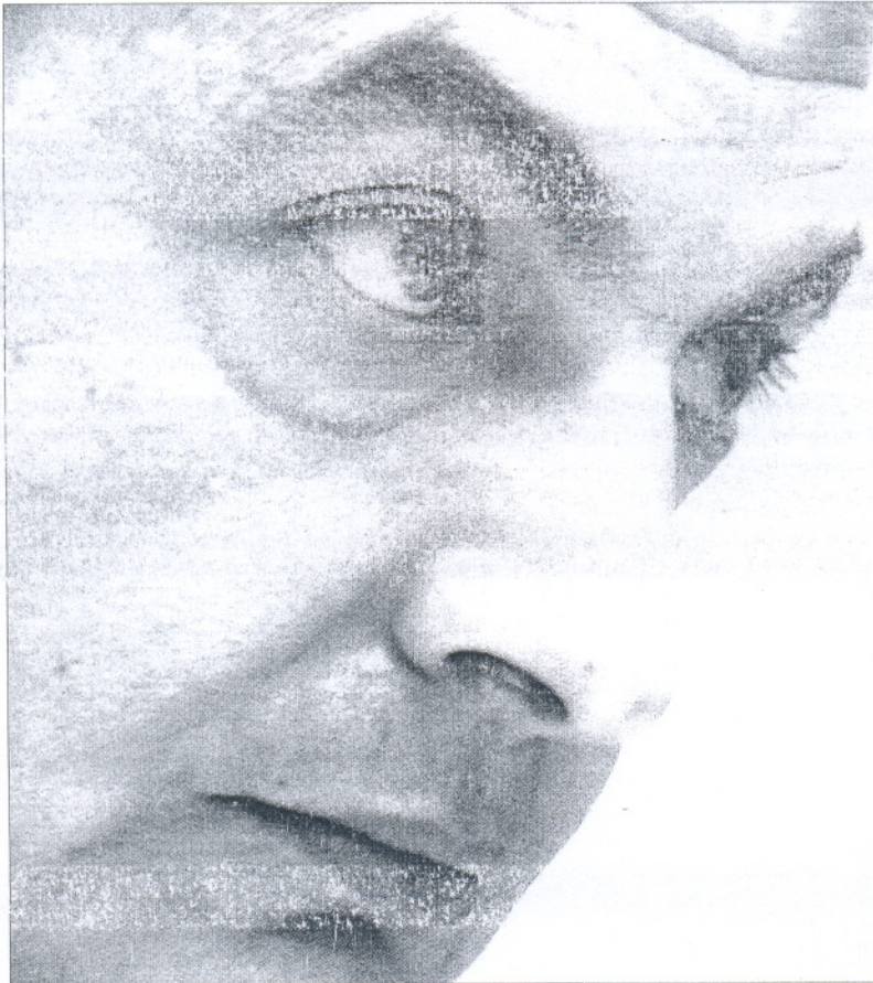
El presidente del Gobierno, José Luis Rodríguez Zapatero, junto al ministro de Trabajo, Celestino Corbacho en una sesión de control en el Senado.

&gt; LA REFORMA LABORAL / La propuesta del Gobierno