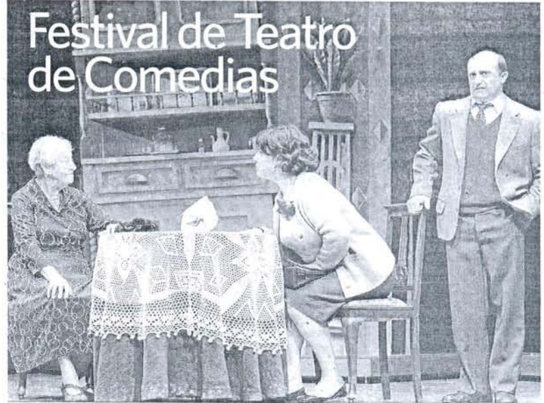
Puesta en escena de la obra 'El pisito'.

CONCURSO DE CANTE 22:00 La primera semifinal del Concurso de Canción Española Villa de Trebujena será celebrada en la peña La Trilla.