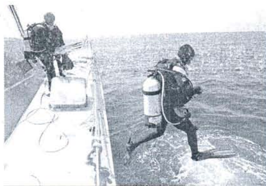
Un buzo de Oceana, lanzándose al mar en el Golfo de Cádiz.

Oceana ha manifestado que en las zonas donde se pretenden instalar los aerogeneradores los fon-