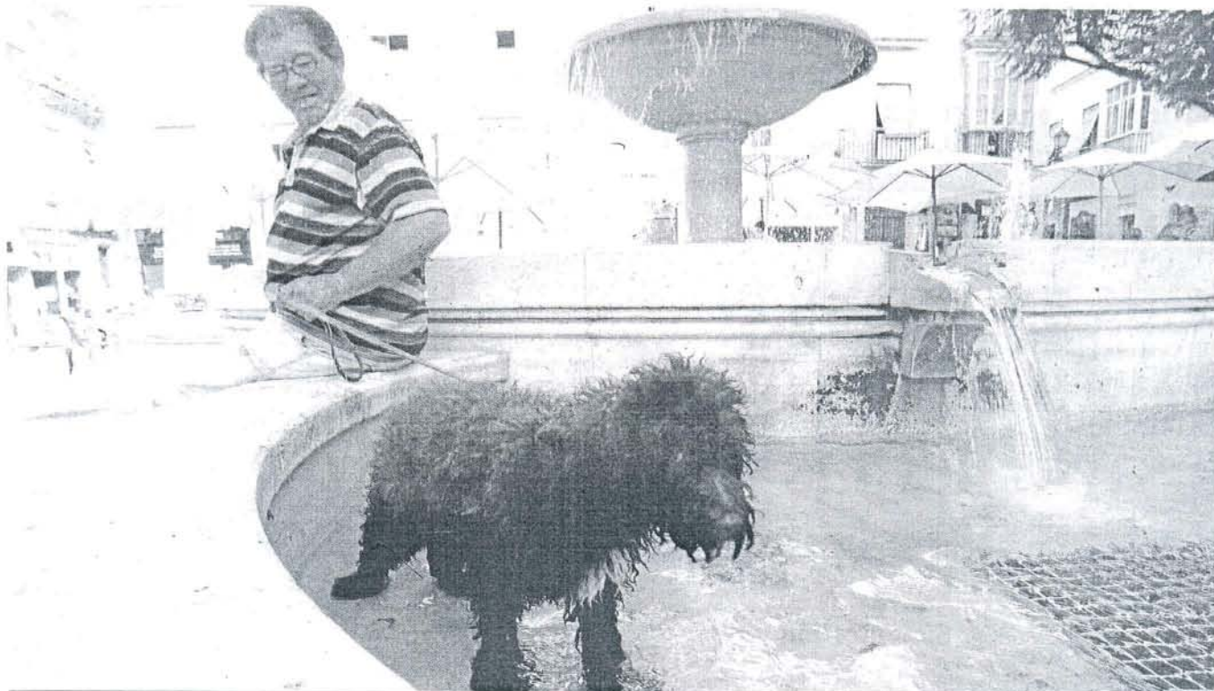
Un perro se refresca en una fuente de la capital para combatir el calor.