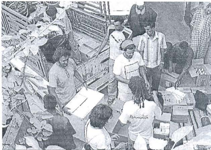
Miembros de Solidaridad Directa descargan una partida de medicinas en Hansala.

Solidaridad Directa se enfrenta en estos momentos al proyecto más costoso, la construcción de la carretera, con ello se abrirá definitivamente el camino al progreso y desa-