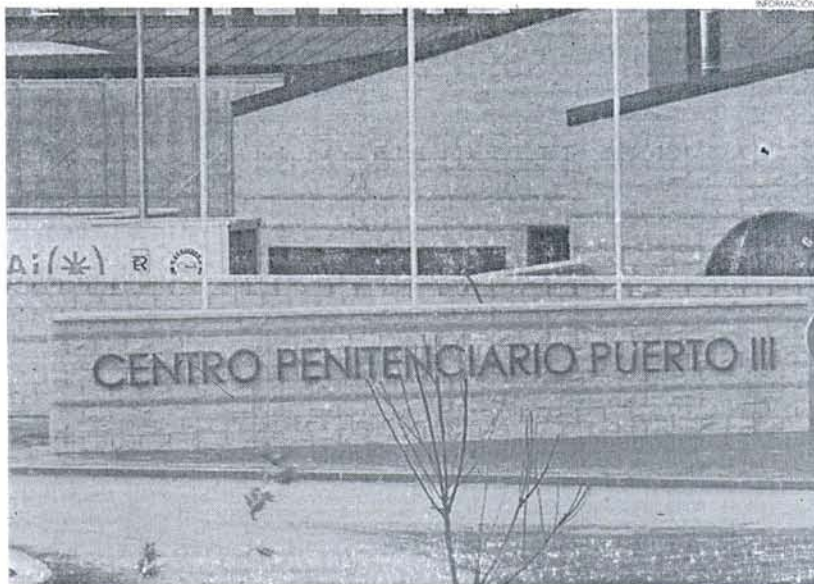
El incidente se produjo sobre las 21.15 horas del pasado miércoles.

El comunicado de la UniónGC explica que los hechos ocurrieron