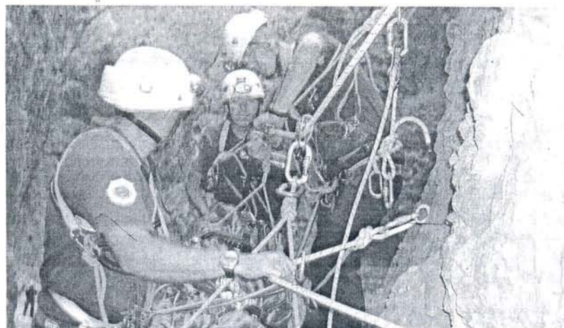
Miembros del grupo de rescate de montaña realizan una intervención pasada.

La alerta amarilla sólo se activó a principios de mes porque se superaron los umbrales: 33 grados de máxima y 24 de mínima