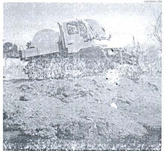
El vehículo es idóneo para intervenir en terrenos más complicados.

un motor de bomba forestal, montándolo todo en una estructura metálica. Esta autobomba proporciona 16 kiles de presión y permite regular el caudal, desde el mínimo, para atajar incendios de cuneta, con lo que la duración de su cuba de agua puede extenderse más de 30 minutos, hasta un trabajo a plena potencia, descargando los 3.000 litros de agua en escasos diez minutos, si las circunstancias lo requieren. Se están preparando mejoras para descargar el agua desde el mismo camión en marcha, así como para preparar un sistema de tuberías y pisteros de protección.