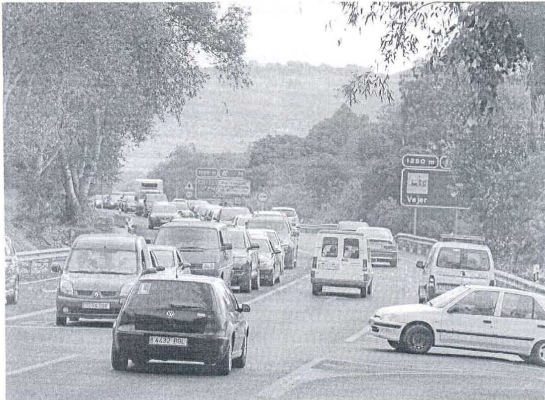
Coches procedentes del litoral conileño, vejeriego y barbateño esperan para incorporarse a la Vejer-Medina, ayer por la tarde.

Pese a que ayer se repitieron las retenciones en los puntos más conflictivos de las carreteras, no se llegó al colapso de otros años porque el lunes festivo propició una salida escalonada de los veraneantes