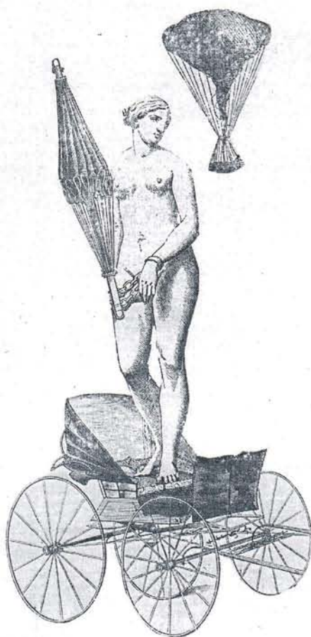
Portada de 'Formulaciones tautológicas'.