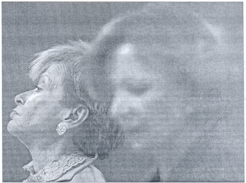
La vicepresidenta De la Vega hace un gesto ayer, en la rueda de prensa junto a Elena Salgado.

► PENSIONISTAS. «Queda suspendida excepcionalmente la revalorización de las pensiones durante 2011,