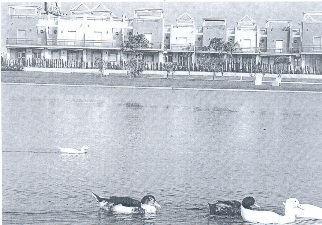
Vista parcial del lago de los patos que delimita Chipiona y Rota. Al fondo, algunas de las viviendas de Costa Ballena que reclama Chipiona.