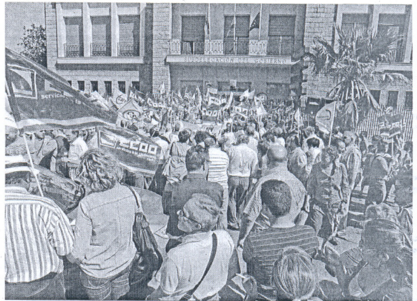
Cientos de funcionarios y sindicalistas se dieron cita ayer en la capital gaditana.