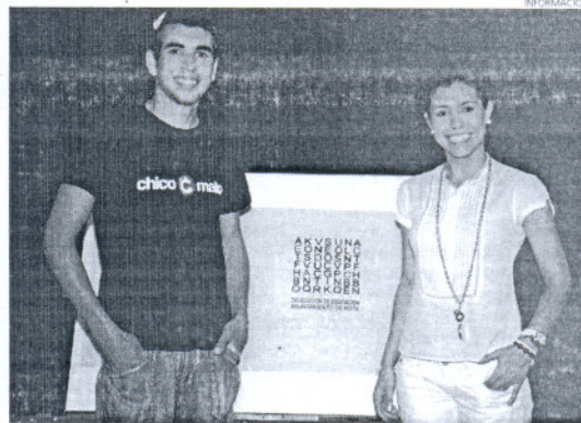
El logo ganador representa una sopa de letras con la palabra Educación.

Un jurado compuesto por profesionales valoró las propuestas y la explicación de los diseños.