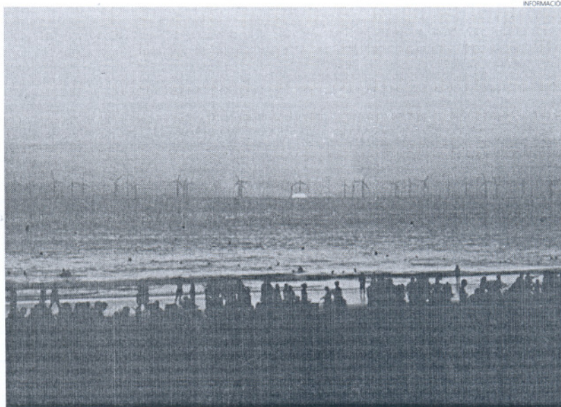
Esta es la simulación realizada desde PA-PSA para demostrar el impacto visual de los molinos en la costa rotea.

"Rota ya sufre una servidumbre lo bastante importante con la base militar en su término municipal, como para ahora sufrir también