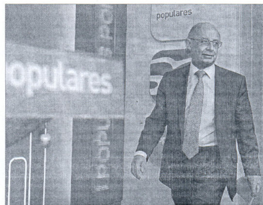
El coordinador económico del PP, Cristóbal Montoro, ayer.

Los recortes, en definitiva, son «el certificado de defunción» de la política económica llevada a cabo por el Ejecutivo socialista, que además «incidió» «ha causado la pérdida de 2.300.000 de puestos de trabajo».