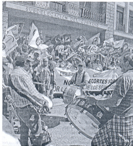
No faltaron los tambores y las bocinas en la concentración.

lante sus propuestas que significan recortar derechos. Avisamos a Zapatero de que no vamos a ceder al más mínimo chantaje emocional que pretende el Gobierno pidiéndonos colaboración; no vamos a permitir ni una falta de respeto más al empleado público. Llevamos más de un año pidiendo soluciones a la crisis y hoy, con la unión sindical que tenemos, no cederemos en lo que corresponde a nuestros derechos para que no se merme nuestra actividad ante los usuarios".