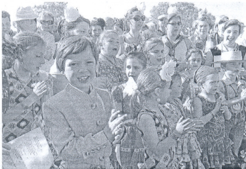
Integrantes del coro infantil de la hermandad de El Puerto. IGUAN CARLOS TORO