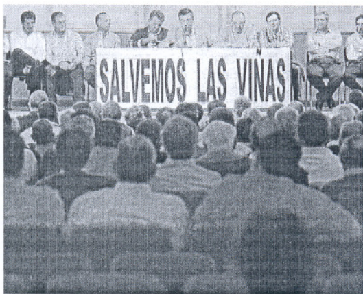
La asamblea convocada por Pladevi en La Merced el pasado 8 de abril.

Así las cosas, este colectivo prevé celebrar reuniones en todas las poblaciones del Marco de Jerez para “reclamar el apoyo tanto de los viñistas como de los políticos y las asociaciones de todo tipo: vecinales, ecologistas, sindicales, culturales y demás”. “Al generar