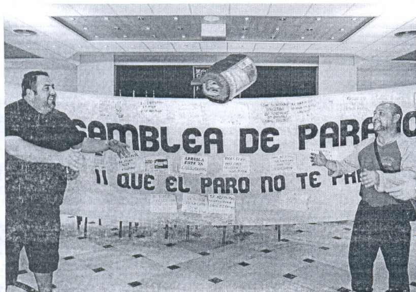
Los parados que iniciaron su encierro en el Castillo de Luna el 8 de marzo abandonaron la protesta el domingo.