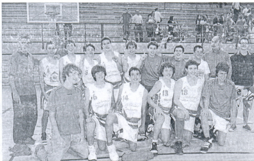
El Adesa'80 de Sanlúcar acude al Regional como campeón provincial.

BALONCESTO • Campeonato de Andalucía infantil masculino