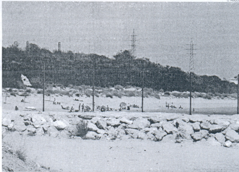
La conocida como 'Playa del Almirante' el pasado verano, cuando instalaban la nueva valla de separación.

Según destacan los Ecologistas, esta nueva construcción ponía de manifiesto la clara idea del Ministerio de Defensa de mantener