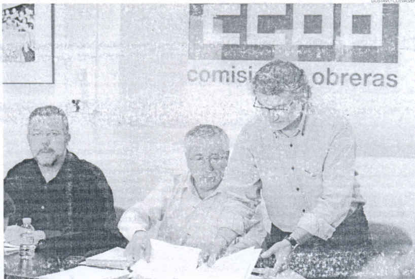
El secretario general de Comisiones Obreras (CCOO), Ignacio Fernández Toxo (c).

Anunciaron que el jueves por la mañana la secretaria de Estado para la Función Pública, Consuelo Rumi, se reunirá con los máximos dirigentes sindicales del sector público en la Mesa General de Negociación de las Administra-