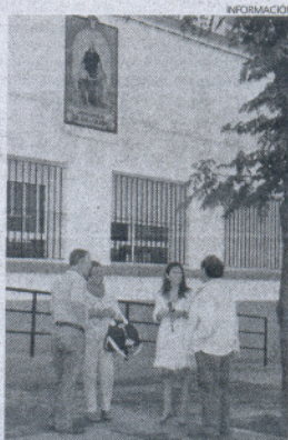
El azulejo ha vuelto a su sitio.

En la fachada es donde se encuentra este azulejo que muestra la figura de San José de Calasanz, que no sólo representa al centro, sino que es el símbolo e imagen