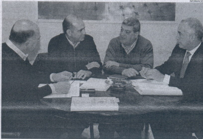
El nuevo contrato garantizará al Ayuntamiento un consumo menor y un gasto de energía sostenible.

El delegado de Gobernación ha comentado que el Ayuntamiento de Rota ha sido el único de la provincia que ha sacado adelante el pliego de condiciones administrativas y técnicas para la licitación de este servicio a empresas eléctricas del Mercado Libre, con objeto de evitar el recargo a partir de abril de este año, de los precios establecidos en el BOE, es decir Tarifa Último Recurso (TUR) más el 20 por ciento sin discriminación horaria. Un recargo que hubiese supuesto un incremento para las arcas municipales del 27,22 por ciento con res-