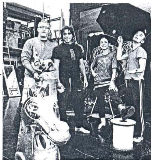
Vagalume Teatro protagoniza un pasacalles.