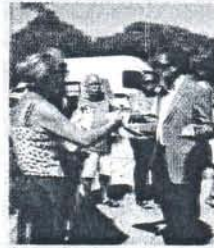
Los vecinos protestaron.

Las obras del centro deportivo arrancan con enfado y tensiones