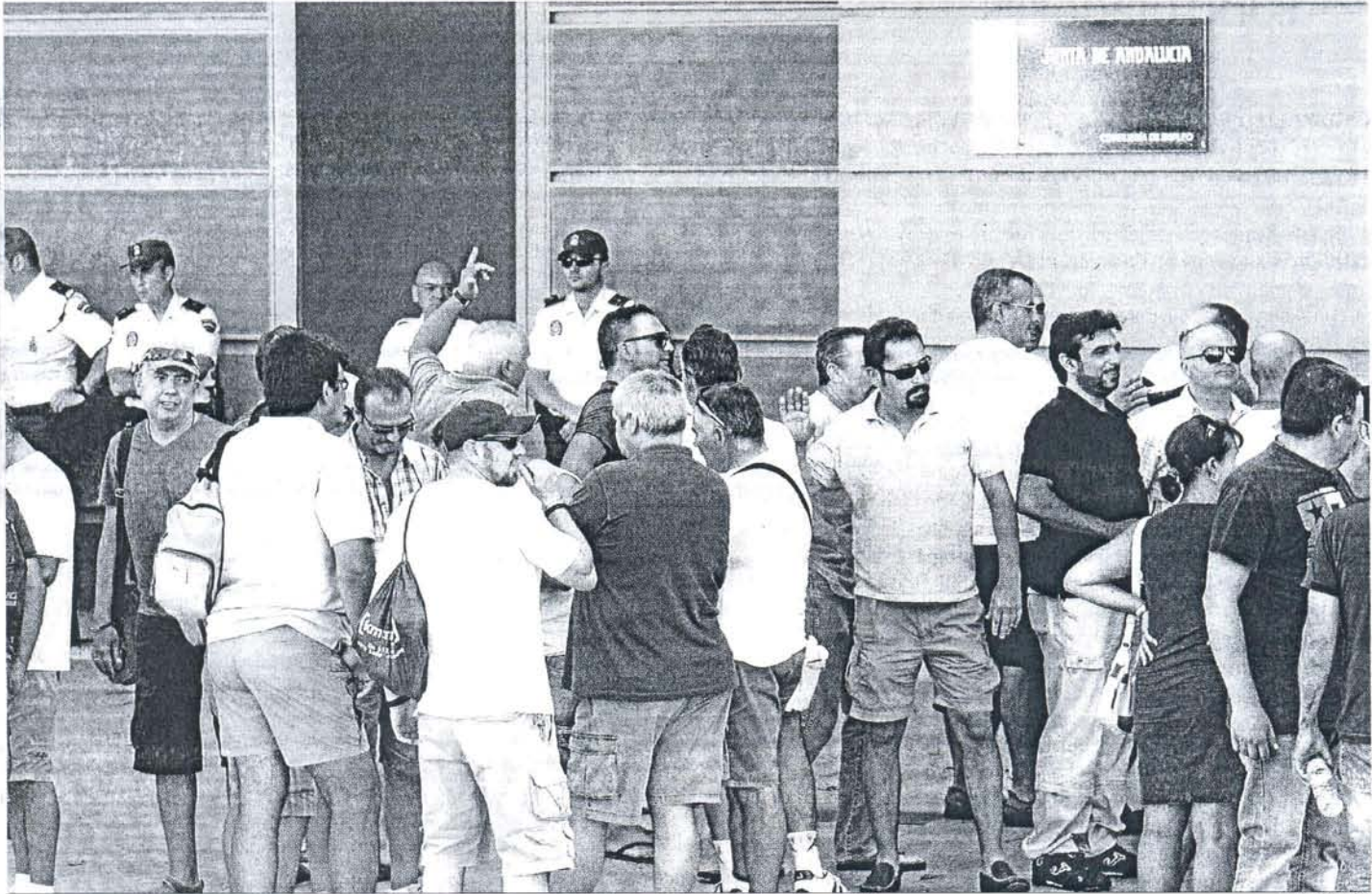
Decenas de ex empleados de Delphi se trasladaron ayer hasta las puertas de la Consejería de Empleo en la capital hispalense.

EL DESCONTENTO Los trabajadores que esperaban el final de la reunión increparon a los representantes sindicales