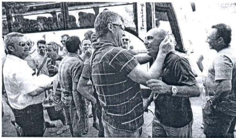
Ex compañeros de la factoría se volvieron a ver ayer en Sevilla.

La Junta admite que su primer objetivo sigue siendo la recolocación pero no habrá más prejubilaciones • La comisión de seguimiento volverá a reunirse en septiembre, cuando se conocerá el nombre de las nuevas empresas