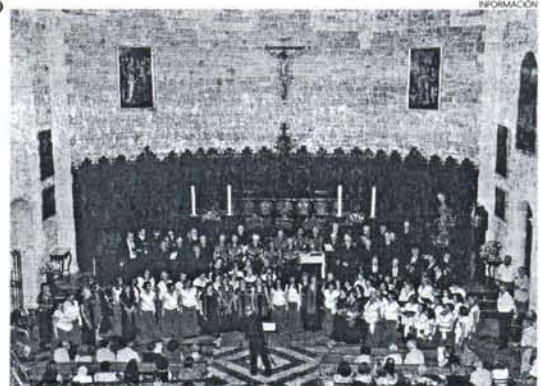
La Iglesia de la O funcionó como escenario para este especial evento.

También incluido dentro del Verano Cultural, ese mismo sábado, la Iglesia de Ntra. Sra. del Rosario Coronada de Costa Ballena, a partir de las nueve y media de la tarde, acogió otro concierto de la mano la Coral de Voces Blancas de la Asociación de Mujeres Serenata Roteña.