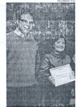
El següño premio del certamen.