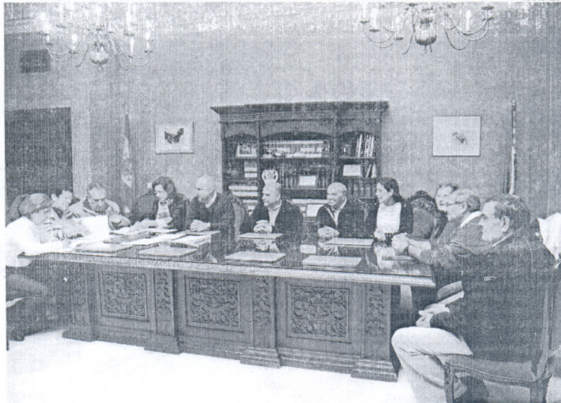
Las obras en la barriada ya han comenzado, y el Consistorio colaborará financiando el 25% de la primera fase.