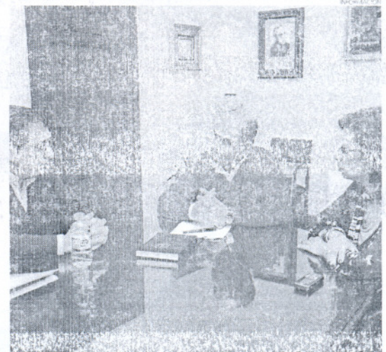
Los ediles conocieron a esta nueva asociación que nace en La Ballena.

Por su parte, los ediles han agradecido el interés, esfuerzo y empeño que los dirigentes de la Asociación están haciendo para conseguir entre todos que el Complejo Residencial de Costa Ballena sea un ejemplo de convivencia entre vecinos. Por ello, desde Urbanismo y Participación Ciudadana se ha manifestado la intención del Ayuntamiento de colaborar en todos los aspectos posibles con la asociación.