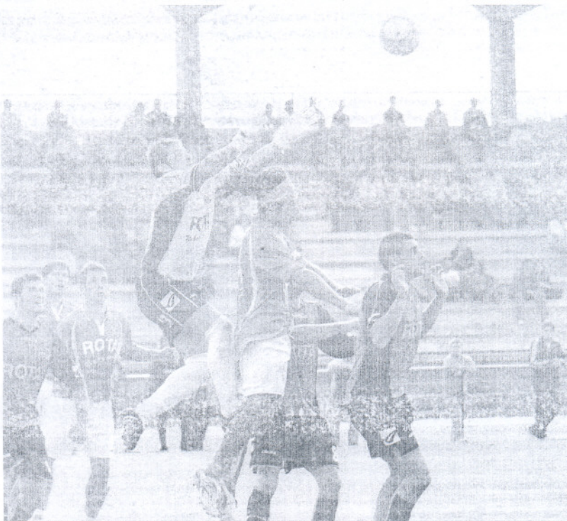
Imagen del derbi de la pasada temporada en el Navarro Flores.