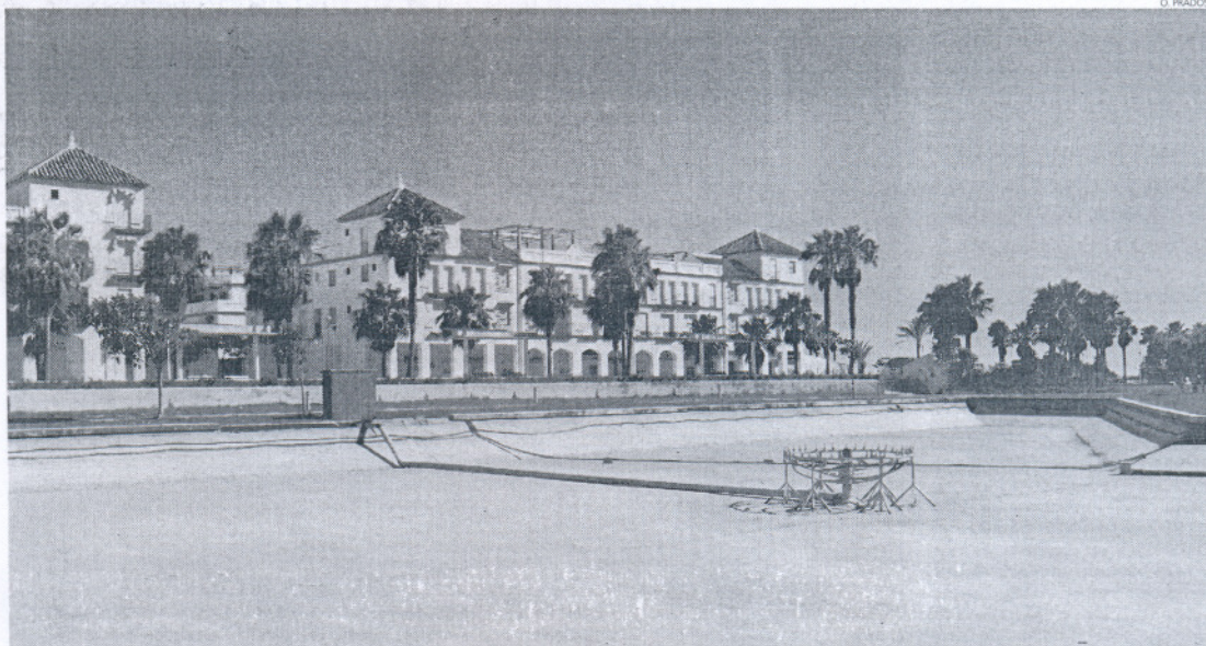
La zona que actualmente ocupa el lago de Costa Ballena, ahora vacío, y una serie de urbanizaciones se incluyen en la franja de 25 hectáreas reclamadas.

Tras consultar la planimetría de los planes de urbanismo, la Delegación de Ordenación del Territorio elaboró un informe en el que explicó que en los Planes Ge-