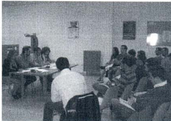
Miembros de Juventudes Socialistas en la Casa del Pueblo

Juventudes Socialistas (JSA) ha celebrado en Rota su ejecutiva y consejo provincial en el que se valoraron los buenos resultados obtenidos en el Congreso Regional de las Juventudes Socialistas y se aprobó el calendario de trabajo de los próximos meses de esta organización, que se centrará en la elaboración de las propuestas programáticas en materia de juventud para las próximas elecciones municipales.