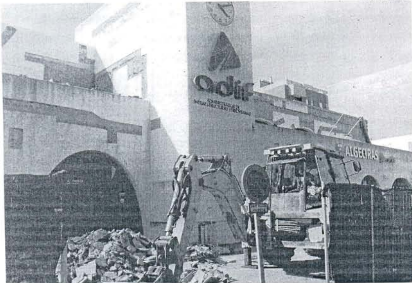
El AVE Bobadilla-Algeciras carece de una asignación que permita "siquiera encargar los proyectos de construcción".