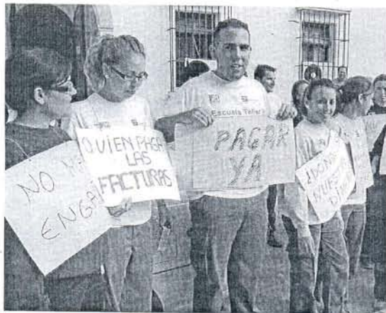
Los empleados trebujeneros protestan diariamente en la localidad.