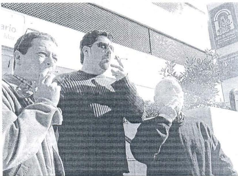
Tres personas fumando en la puerta del hospital Puerta del Mar en Cádiz.

En lo que se refiere a los clubes de fumadores, el PSOE e IU están ultimando una enmienda transaccional, que el PP no comparte al entender que se trata de una actividad privada que no es objeto de este proyecto de ley, según señaló su portavoz, Mario Mingo.