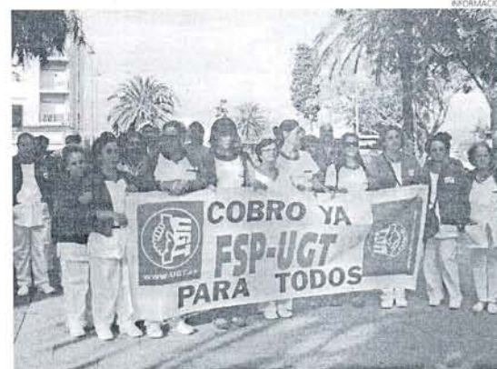
Las trabajadoras en una manifestación por las calles de San Roque.

En cuanto al estado de las negociaciones, desde FSP-UGT informa que la propia empresa ha señalado que las trabajadoras iban a empezar a lo largo del día de ayer a cobrar sus salarios atrasados. Pero las trabajadoras han decidido por unanimidad proseguir con la Huelga Indefinida hasta que no esté ingresado la totalidad de lo adeudado en cada una de las cuentas corrientes.