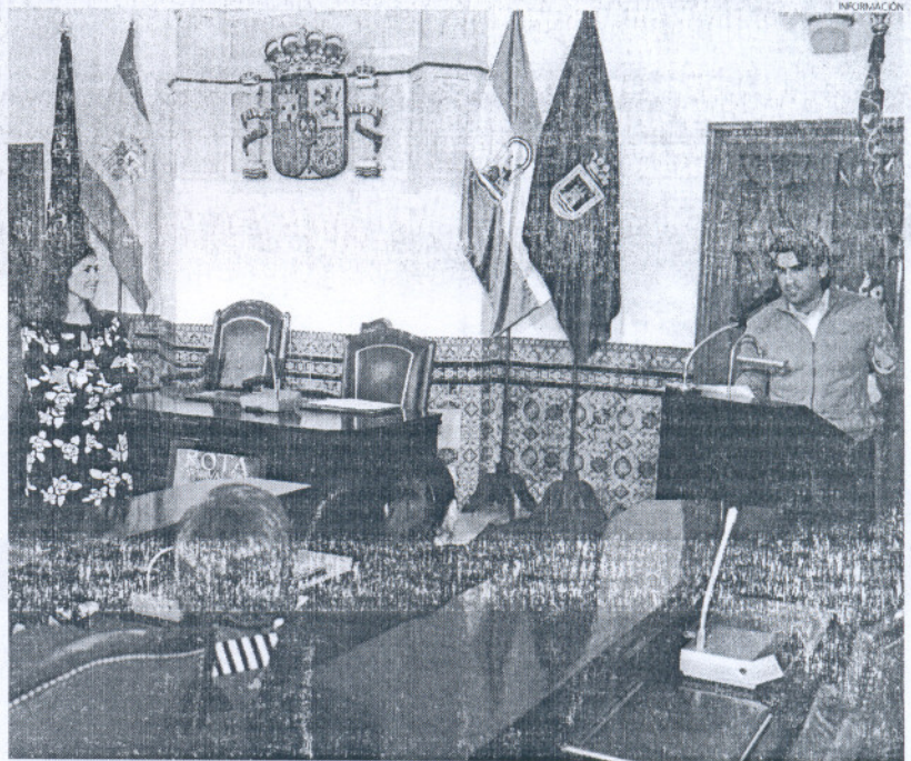
Una imagen del acto oficial que tuvo lugar en el Palacio Municipal Castillo de Luna.

Tras las palabras de agradecimiento del joven ganador, el acto