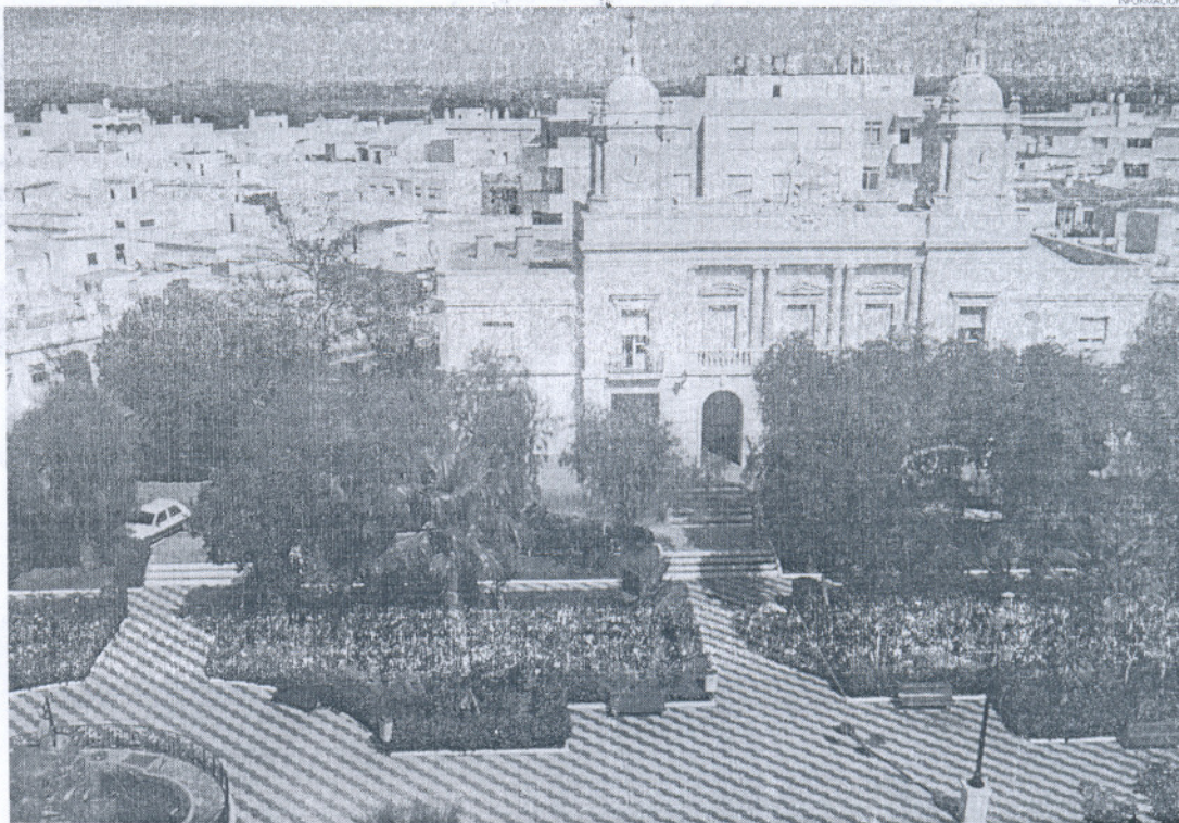
Cada barbateño adeudaría a la Seguridad Social unos mil quinientos euros. En la imagen, el Ayuntamiento barbateño, segundo más moroso de España.

Los números no mientan. Los Barrios, con una deuda acumulada de 27.493.636 de euros; Barbate, con una cifra que supera los 26.000.000 de euros; Tarifa que adeuda 17.299.795 de euros, Manilva (Málaga) que supera los 16 millones de euros; y Jerez, con cerca de 8 millones de euros, ven como su gestión municipal cojea y está supeditada a estas cuentas deficitarias, de la que no se esca-