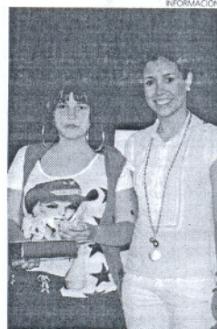
La edil de Educación en la entrega.

Además, la Delegación de Educación ha hecho llegar a través de los profesores un diploma acreditativo y un vale descuento para el cine, a todos los alumnos que tomaron parte en este certamen como premio por su participación.