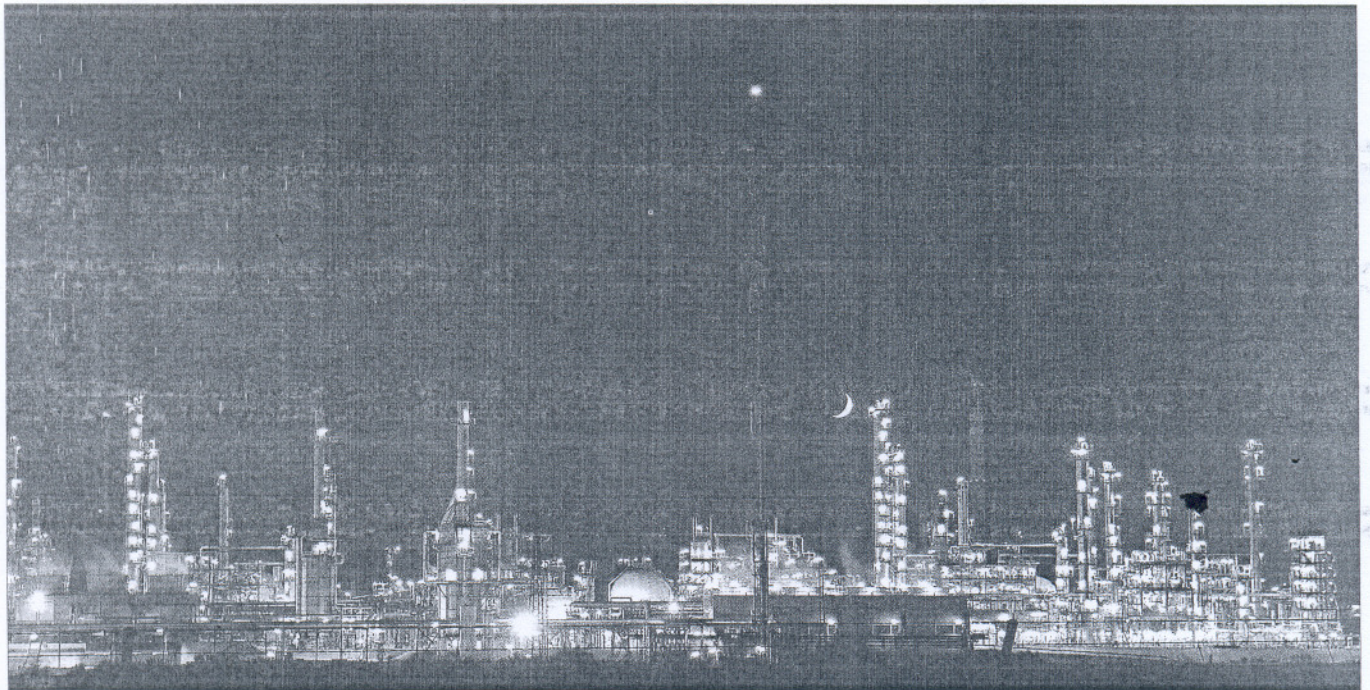
Una imagen del Polo Químico de Huelva realizada para un estudio sobre la influencia de la contaminación lumínica.