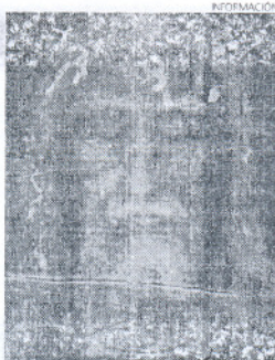
El rostro que se ve en la Síndone.

El programa de actos tiene todavía pendientes numerosas actividades que terminarán en el mes de octubre.