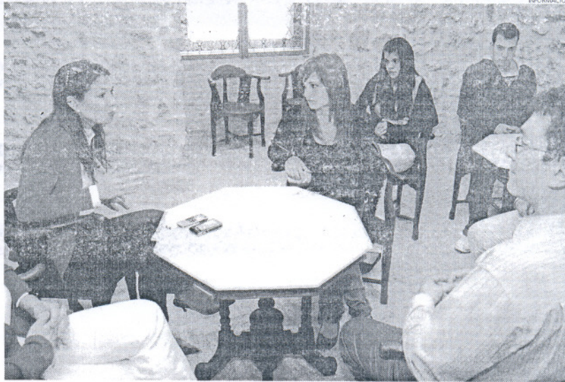
La delegada de Educación, Auxiliadora Izquierdo (i), explicó a los alumnos en qué van a consistir sus prácticas.

Los alumnos desarrollarán sus prácticas durante cuatro días a la semana, hasta el mes de junio, de manera que la duración de estas prácticas sea como máximo de 140 horas. Durante sus prácticas los alumnos podrán realizar además de tareas más generales, trabajos