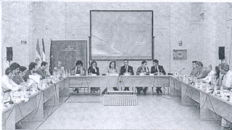
Imagen de la comisión de ordenación y urbanismo con representantes económicos, sociales y políticos.

La comisión de ordenación de Andalucía da el visto bueno a los POT, con una inversión prevista de 530 millones de euros