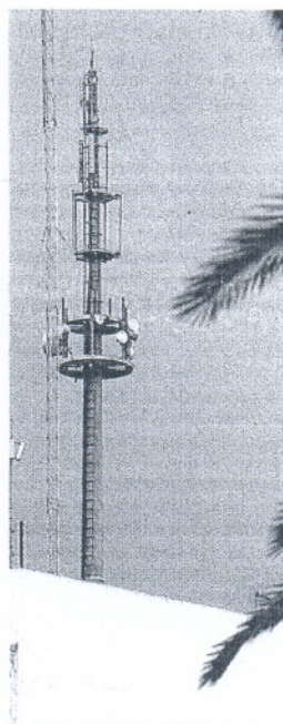
Una antena reemisora andaluza.

En ambos casos andaluces, el problema no es de cobertura, como han señalado a este periódico fuentes de la Junta y del Ministerio de Industria, sino de las interferencias que se han avivado con la subida de las temperaturas y que no podían preverse. La empresa concesionaria del servicio, Abertis, acelera la solución y en el caso de la provincia de Cádiz deberá de estar atendido para el lunes 14. En esa fecha se van a resintonizar todas las frecuencias para que la señal del repetidor de la Sierra de San Cristóbal no se interfiera con la que lanza el emisor onubense de Punta Umbria. Este 'choque' de señales provocaba la desaparición de diversas frecuencias. Los canales en la provincia de Cádiz se cambiaron poco antes del apagón analógico para no interferir con un repetidor marroquí en la demarcación de Tánger. Ese cambio, a su vez, sufría la interferencia con la señal de Huelva, como se ha demostrado en las últimas semanas, con las quejas lanzadas por los sectores hotelero y hosteleros con vistas al acontecimiento del Mundial de fútbol. En la localidad de Medina Sidonia se está también analizando el problema de 'pantalla' de recepción que sufren