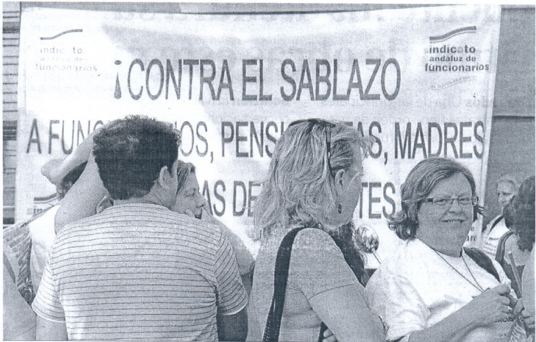
Funcionarios se concentran ayer frente a unas oficinas de la Junta en Sevilla, una movilización que se repitió en las ocho capitales andaluzas.