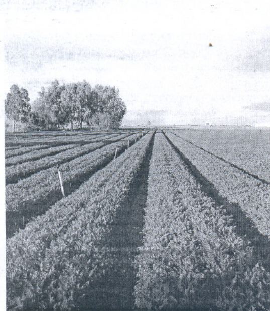
Una plantación de zanahorias en Monte Algaida.

Los regantes de Monte Algaida solicitaron esta medida para garantizar el agua en mil hectáreas de cultivos