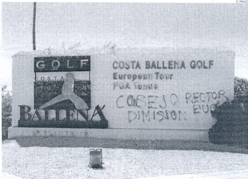
Pintadas como ésta se reparten por sitios clave del complejo turístico pidiendo la dimisión del Consejo de la EUC.

La entidad, presidida por Eusebio Sánchez, afirma en este comunicado que lo que han tratado de poner en marcha desde su toma de posesión en enero es "una gestión austera y eficaz, y teniendo siempre en cuenta el actual estado económico de su tesorería,