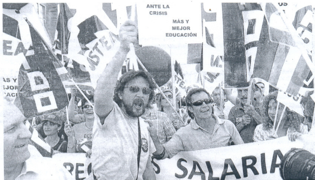
Una reciente protesta de funcionarios tras anunciar el Gobierno el recorte salarial.

SERVICIOS MÍNIMOS En Sanidad estarán el 50% de las plantillas, un directivo en los centros escolares, y un funcionario en cada juzgado