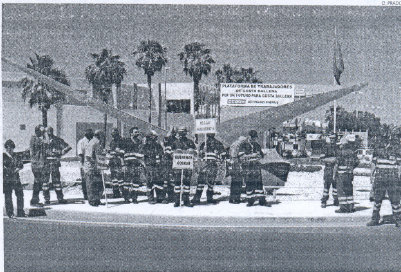
Los trabajadores han decidido proseguir con sus movilizaciones hasta que no dimita la Junta Directiva de la EUC.