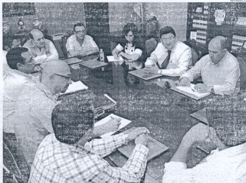
Desde el principio los trabajadores de la EUC han informado al alcalde de sus intenciones y sus preocupaciones.

bajadores desde que tomara posesión el nuevo Consejo Rector.