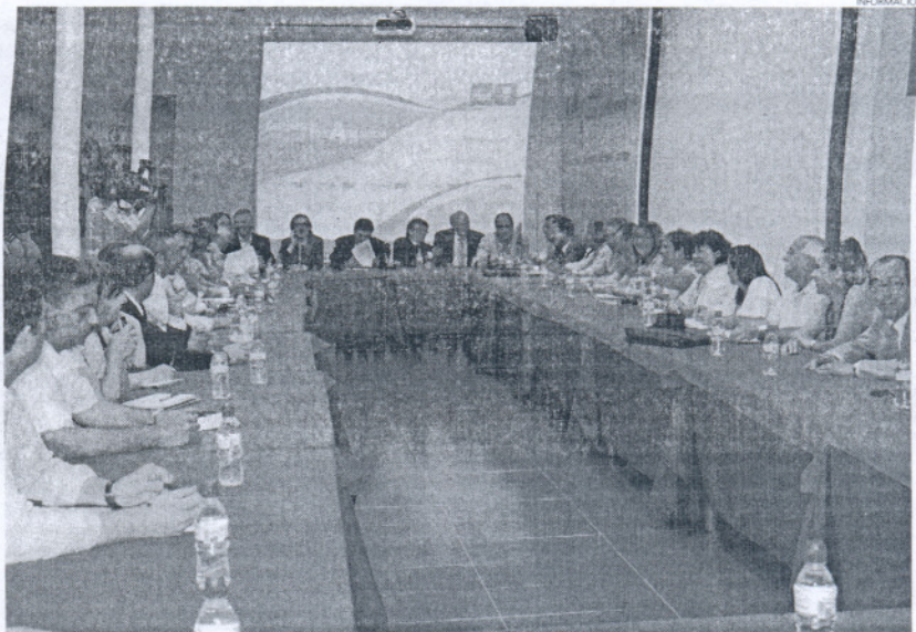
Imagen de la reunión que tuvo lugar ayer de los alcaldes y concejales socialistas celebrada en Cádiz.

Cabaña resaltó que "Cádiz es la provincia andaluza donde más baja el paro, siendo el sector servicios es el que mejor se comporta en la provincia, mientras que el sector de la construcción da síntomas de recuperación, aunque lenta. Hay una tendencia de cre-