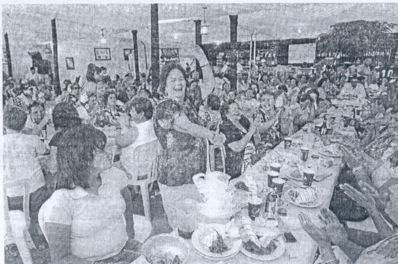
La segunda jornada de la Feria de la Manzanilla se desarrolló con una especial animación en el Real.