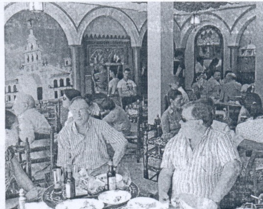
La caseta 'Los informales' ha ganado este año el concurso de decoración.