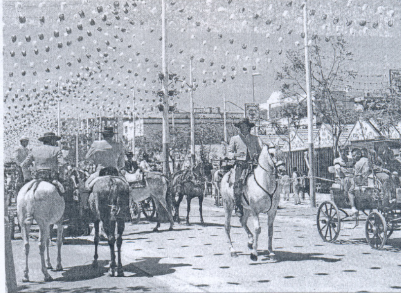
Ayer se desarrolló la primera de las dos jornadas reservadas para los aficionados al mundo del caballo.