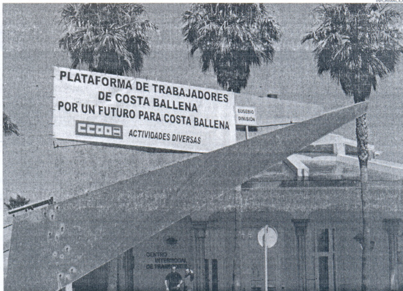
La entrada de Costa Ballena recibe a sus residentes y visitantes con esta pancarta sobre la veleta.

El alcalde ha explicado que la huelga ha estado provocada precisamente por la gestión que viene desarrollando el nuevo Consejo Rector de dicha entidad; una