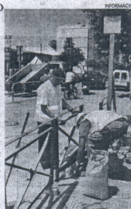
Los operarios trabajan ya en el cruce.

Además, el proyecto que se acomete en este punto también contempla la creación de un tercer