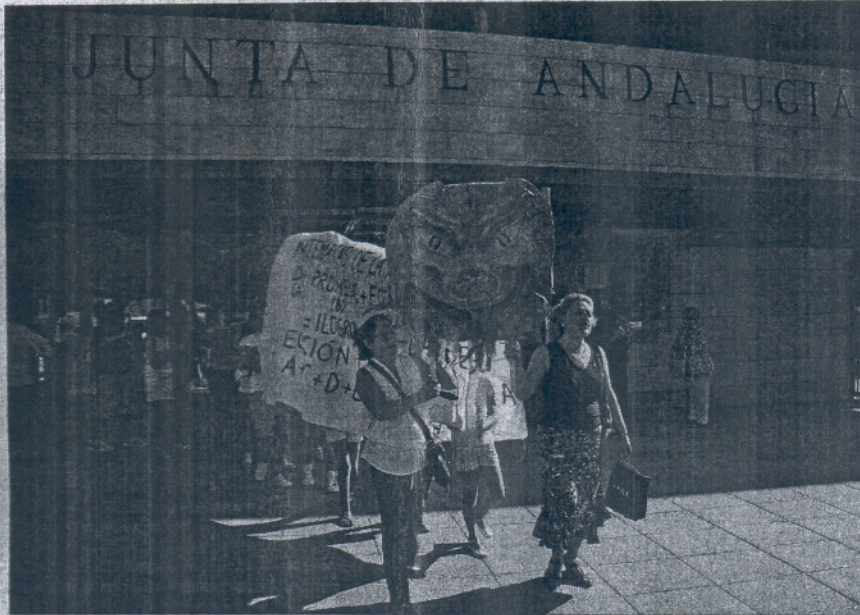
Concentración de padres de alumnos, ayer ante la sede de la Consejería de Educación en Sevilla.

Sindicatos de Enseñanza y asociaciones de directores y profesores de Primaria y Secundaria exigían a la Junta, en un acto de protesta, «explicaciones claras» de por qué el próximo curso «va a recortar plantillas y horarios» en todos los centros públicos, informa Europa Press.