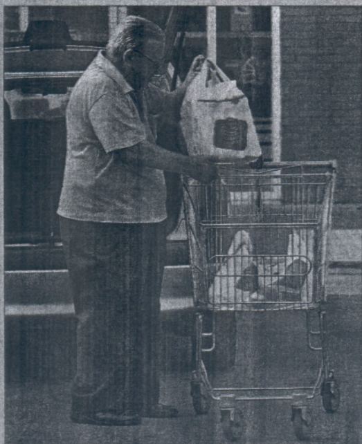
Un hombre utiliza bolsas de un uso, que serán gravadas en 2011.

► Se modifican las tasas por ordenación de transportes mecánicos por carretera , por servicios en materia de caza y por expedición de títulos para el gobierno de embarcaciones de recreo y de tarjetas de identidad marítima .