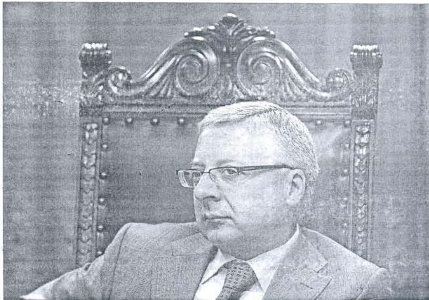
El ministro de Fomento en una comparecencia en Brasil, dos días antes del anuncio de una subida de impuestos.

>15 de agosto. El ministro José Blanco afirma, en una entrevista a Europa Press, que los impuestos en España «son muy bajos» y que es partidario de homologarlos al resto de Europa.