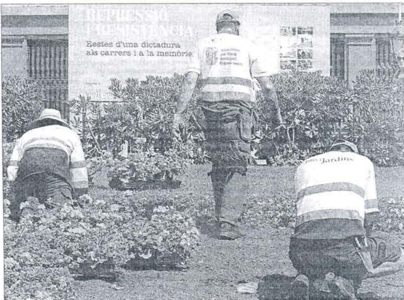
Jardineros, en una plaza de Barcelona.

En el ministerio responden que esta medida se tomó de acuerdo con otras fuerzas políticas en el marco del pacto de Zubano, el pasado mayo. "Hemos aprobado ajustes para todas las administraciones. Solo pedimos a los Ayuntamientos que no in-