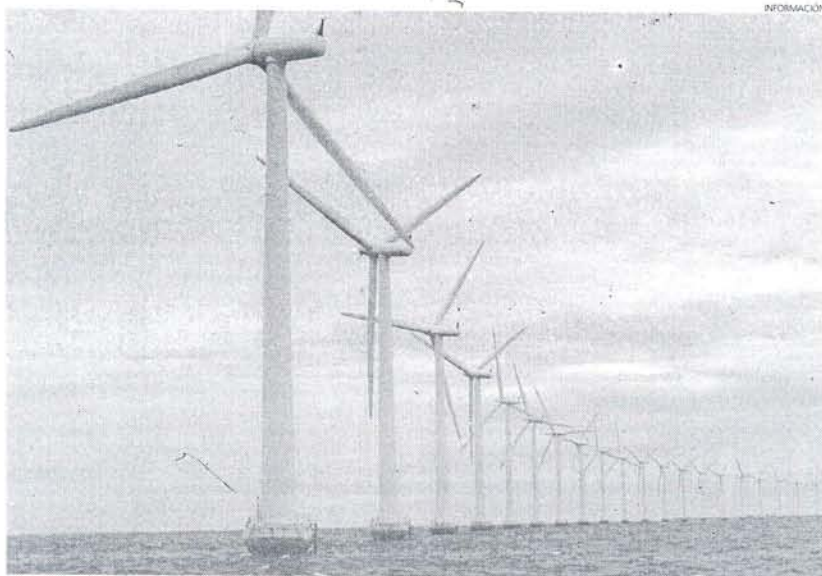
Esta es una imagen que Roteños Unidos no quiere ver cerca de sus costas por el perjuicio que ocasionaría.

Sin embargo, respecto al parque eólico recalcan que pese a que