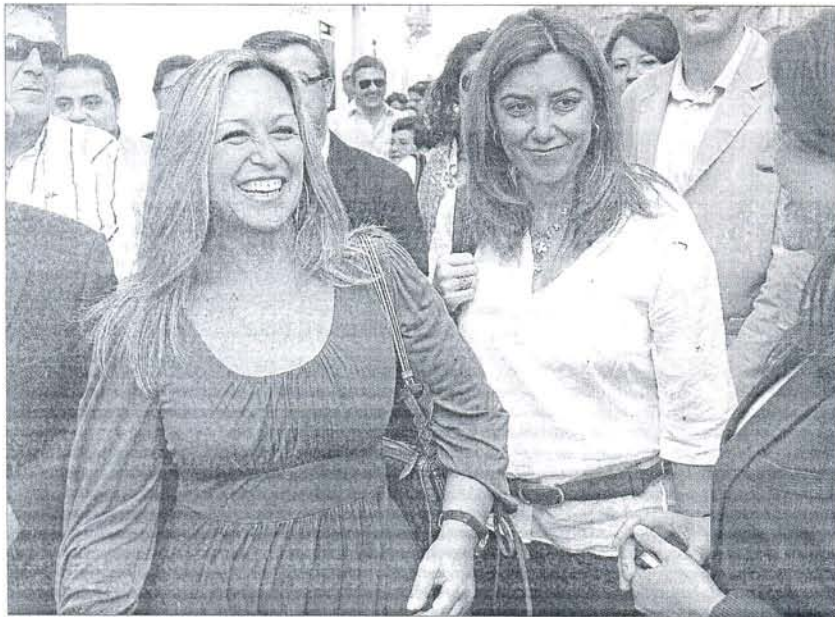
La socialista Susana Díaz (dcha.) junto a la ministra Trinidad Jiménez, candidata a primarias en Madrid.