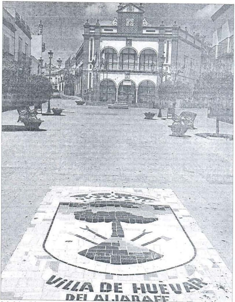
Sede de la Policía Local de Huévar del Aljarafe, antiguo Ayuntamiento.

"Yo mismo", continúa, "no cobro desde diciembre". ¿Y el alcalde? "Todos estamos en la misma