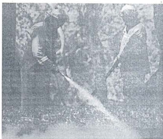
En las labores de extinción trabajaron un centenar de personas.

Cabe recordar que fueron los vecinos de la zona los que dieron la voz de alarma del fuego originado, cercano a las carreteras A-2231 y N-340, y que se encuentra ya controlado gracias al dispositivo aéreo desplegado que se hizo necesario dadas las características rocosas de acceso a la zona del campo de tiro.