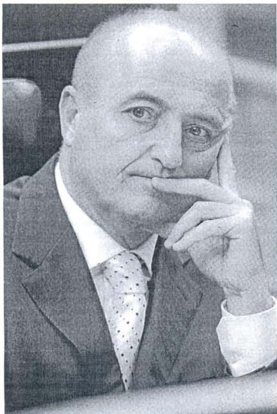
El ministro de Industria, Miguel Sebastián, ayer en el Congreso.

Esta es la segunda subida de la tarifa regulada del año, ya que el pasado 1 de enero ya subió alrededor de un 2,6%. En junio, el Gobierno acordó con el PP congelar la subida de la luz