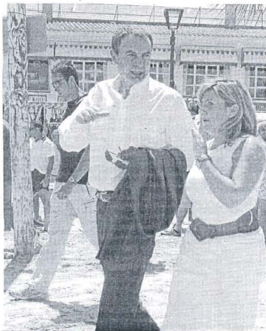
La alcaldesa, con el presidente Zapatero en una de sus visitas a la ciudad.

El PSOE ha destacado que la actual alcaldesa ha logrado en este mandato "normalizar la vida política municipal y no gobernar de espaldas a los ciudadanos", tomando decisiones como la puesta en marcha de "un ambicioso plan