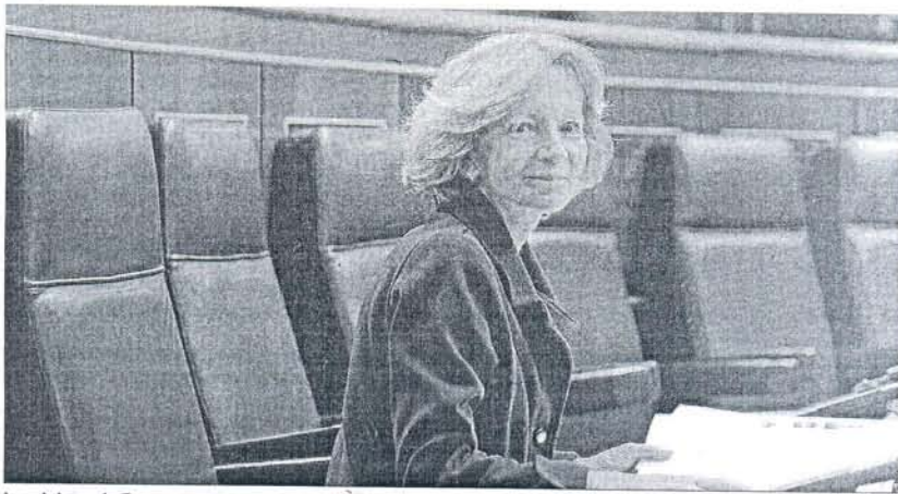
La ministra de Economía, Elena Salgado, ayer, antes del pleno del Congreso de los Diputados.

De este modo, aplicar un tipo marginal del 45% a rentas superiores a 120.000 euros supondría una recaudación adicional de