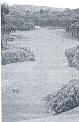
Club de Golf Valderrama.

En su opinión, se trata de "un evento de primerísimo nivel" que reúne muchos ingredientes, entre los que destaca el hecho de ce-